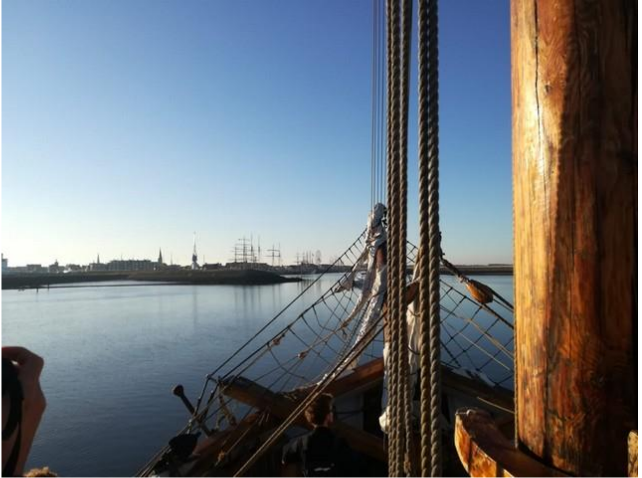
Op zaterdag hebben we meegedaan aan de crewparade en werd bekend gemaakt wie de winnaars waren per klasse. Wij zijn als vierde geëindigd in klasse B.