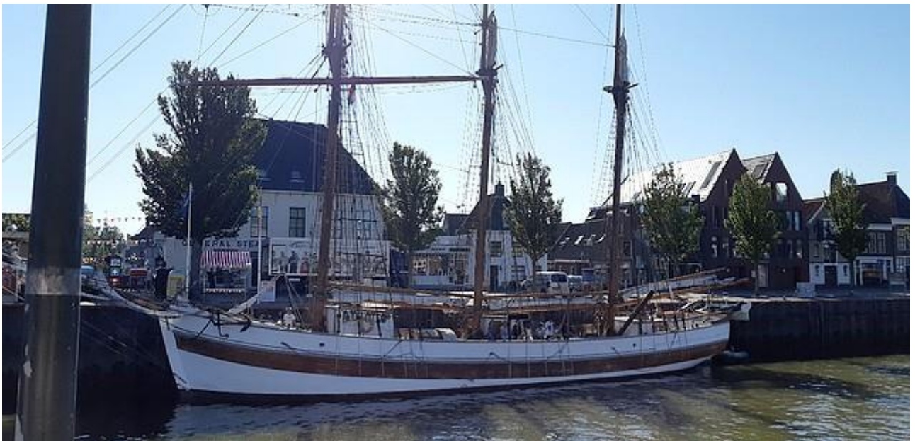
Na een overnachting op het schip in de haven van Stavanger, vertrokken we op zondagmiddag richting Harlingen.