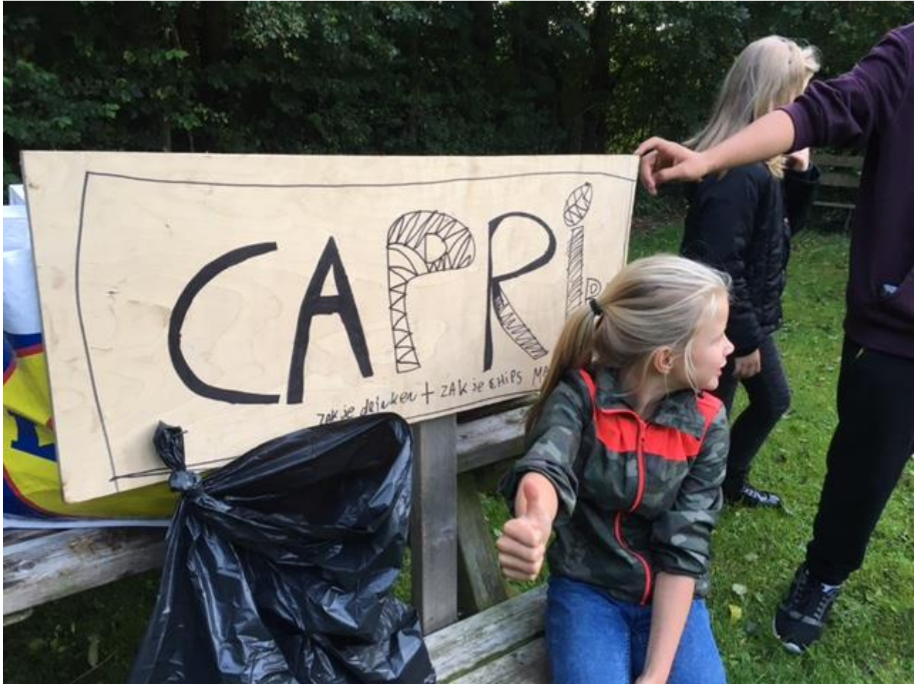
Dit was het pauze punt met parcour in de speeltuin. Hier konden de kids een zakje chips en wat drinken krijgen.