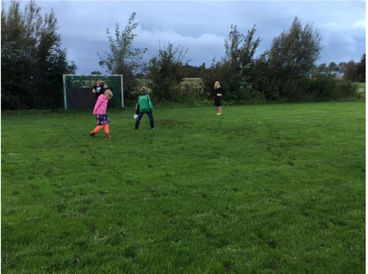
Hier moesten er zoveel mogelijk goals gescoord worden.