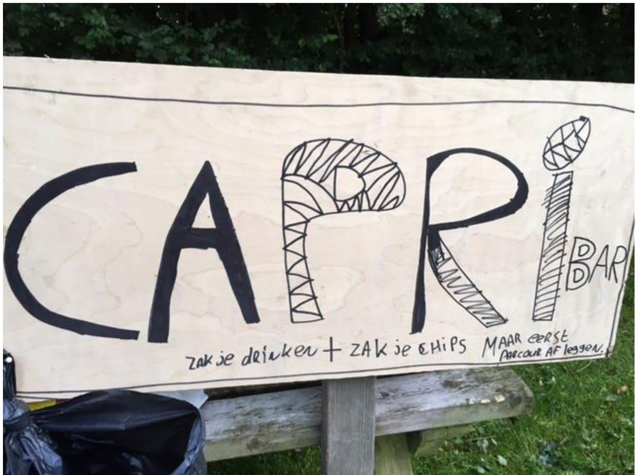
Erwin had dit coole bord gemaakt!