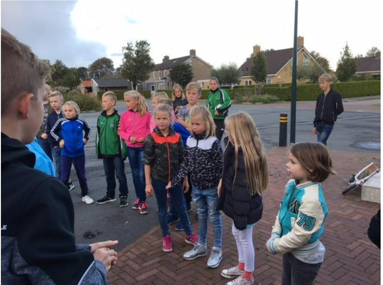
Zelfs het verdelen in groepjes is altijd een spannend moment! Bij wie zou ik zitten?