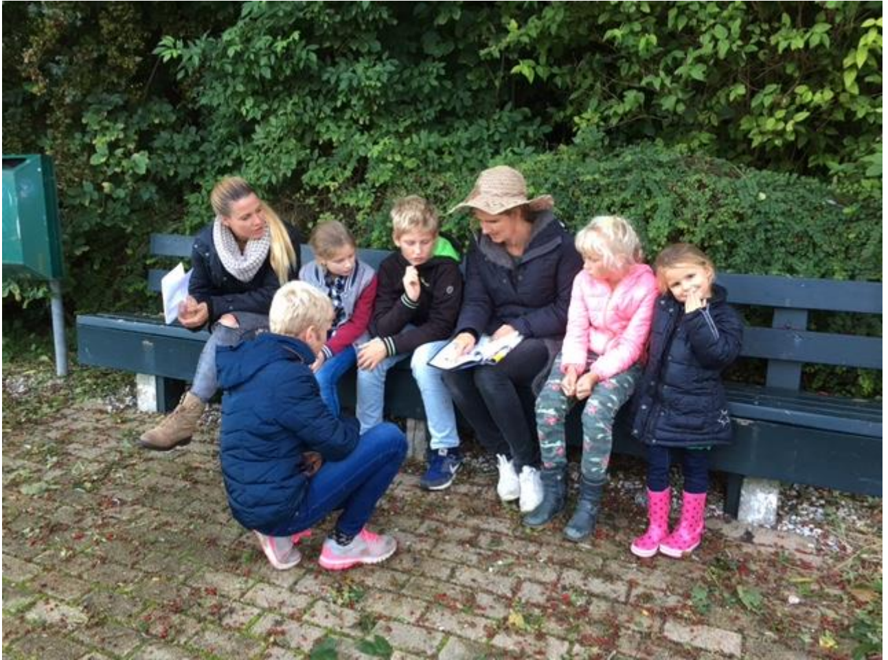
Hier moesten de kinderen rebussen oplossen. Nog best lastig hoor!