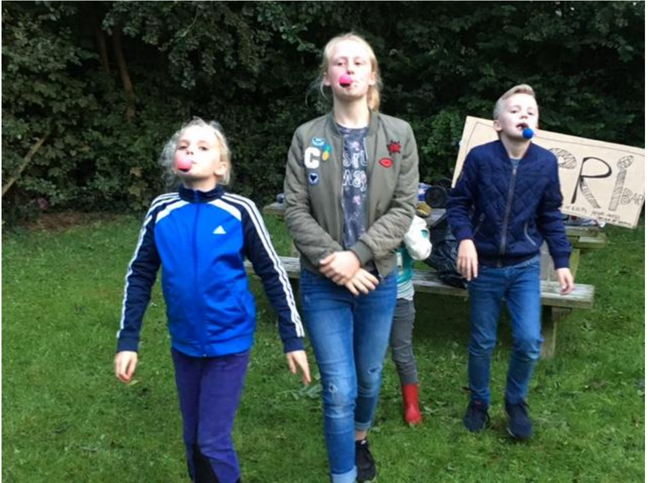
Al met al een geslaagde eerste clubavond!