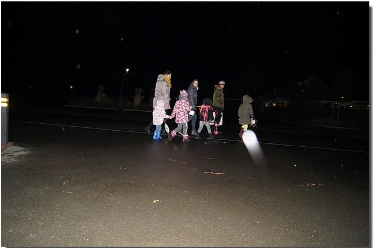
En onder leiding van de jeugdclub gingen ze van start.