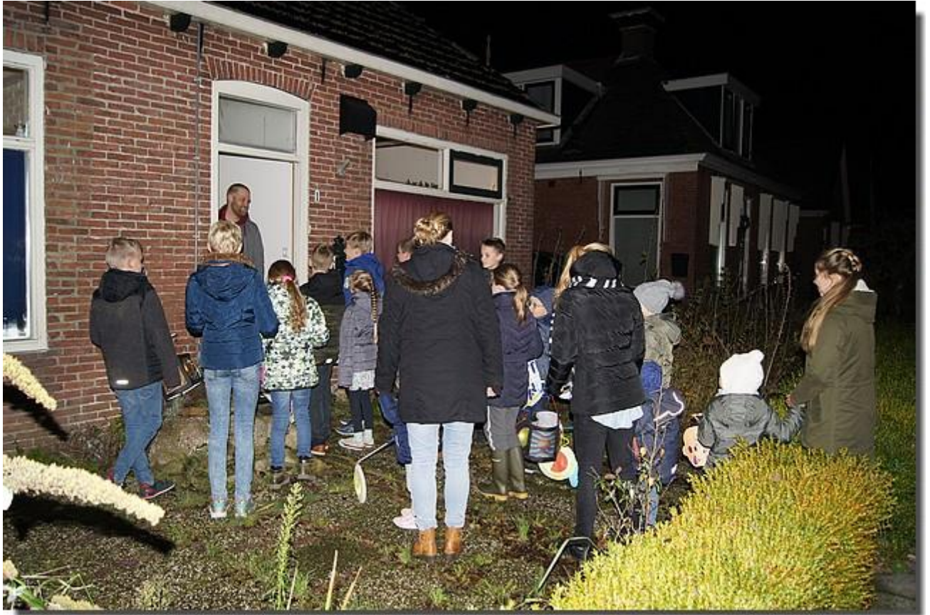
Voor de bewoners wel zo prettig.