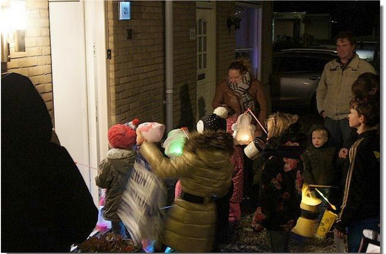
In ons dorp komt er maar één keer een groep langs.