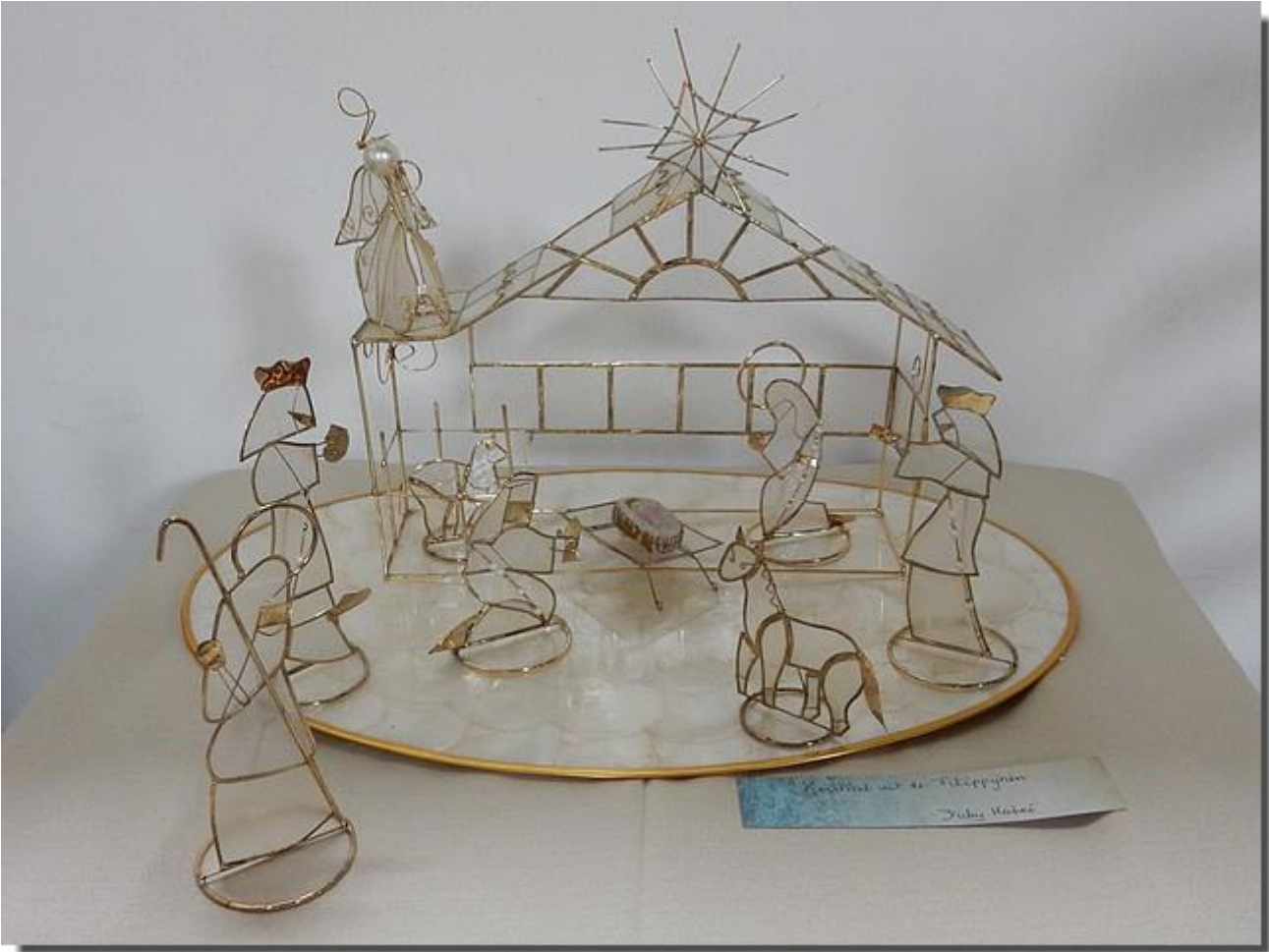
Handmade wire sculpture Julius Krieger