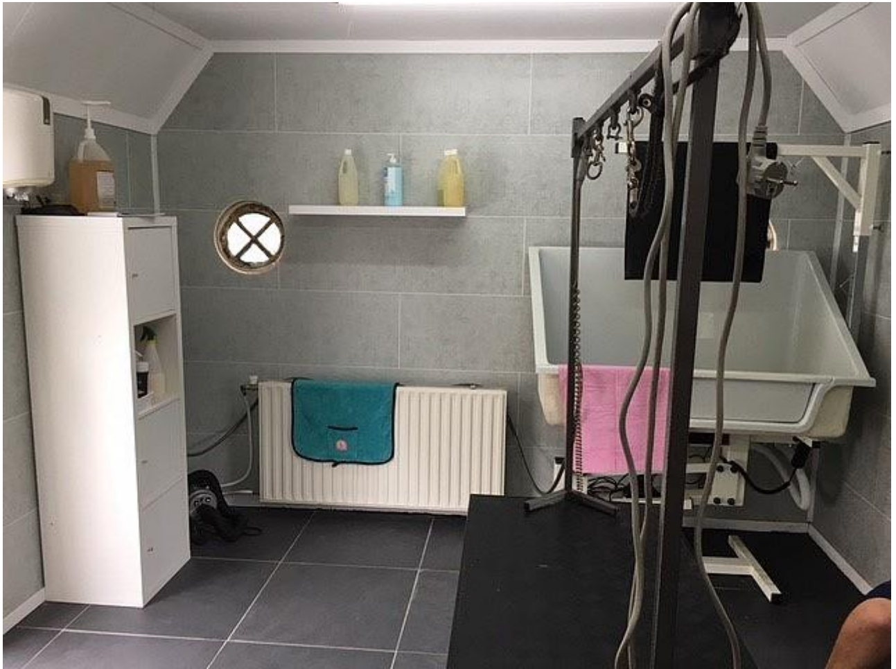
De wanden zijn bekleed met pvc. Dit is makkelijk om schoon te maken