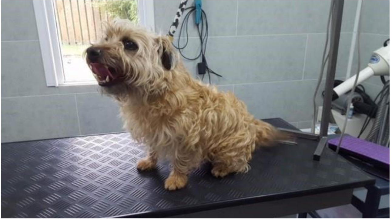
Dit hondje was toe aan een behandeling.