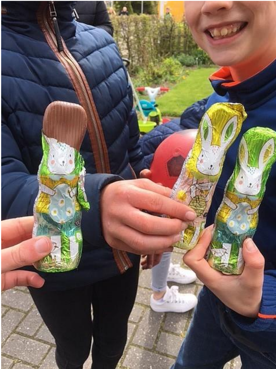
De kinderen wel en zij werden beloond met een heerlijk paashaas!