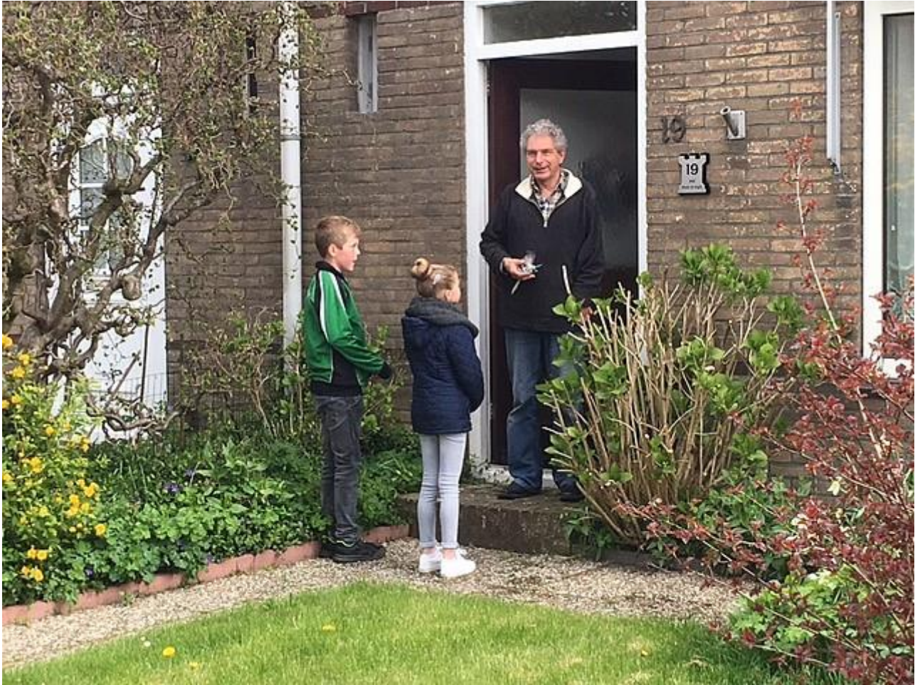
Ook alle leden van de buurtvereniging kregen een presentje aangeboden.