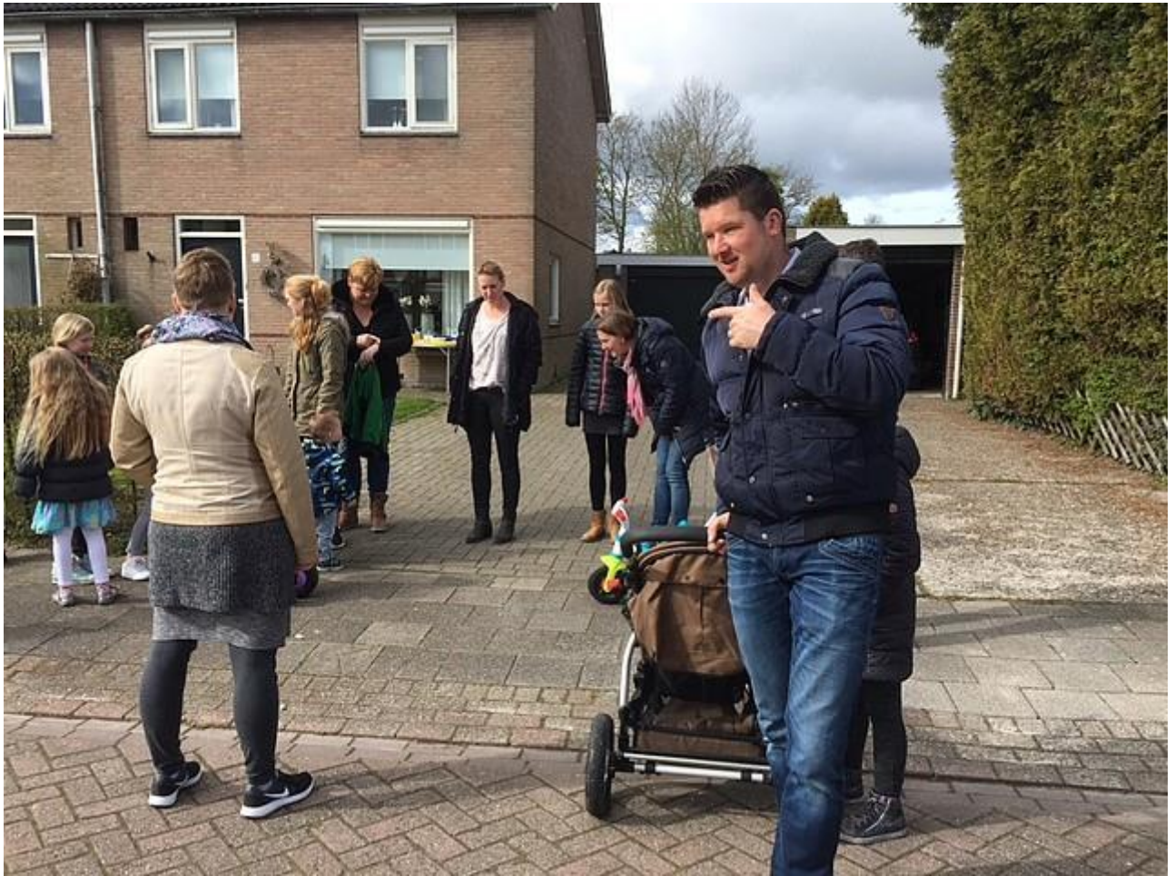
Om half 11 verzamelde iedereen zich bij nr 10