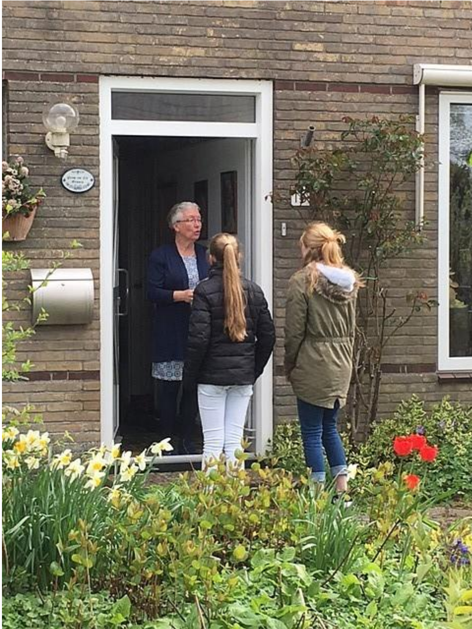
Dit werd vriendelijk in ontvangst genomen.