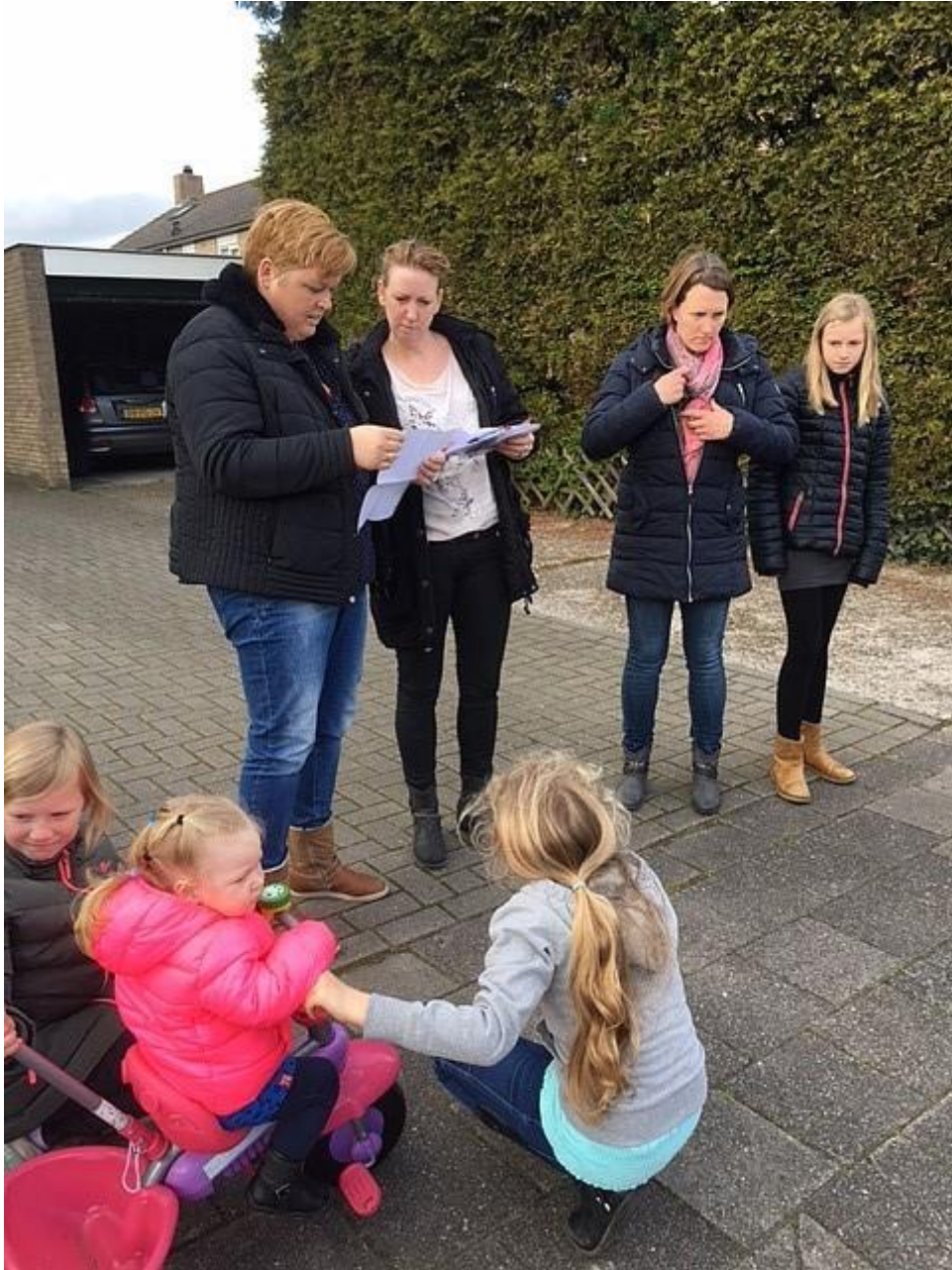
De laatste details werden even doorgenomen.