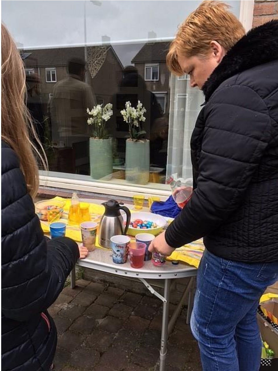
Maar eerst even een glaasje ranja