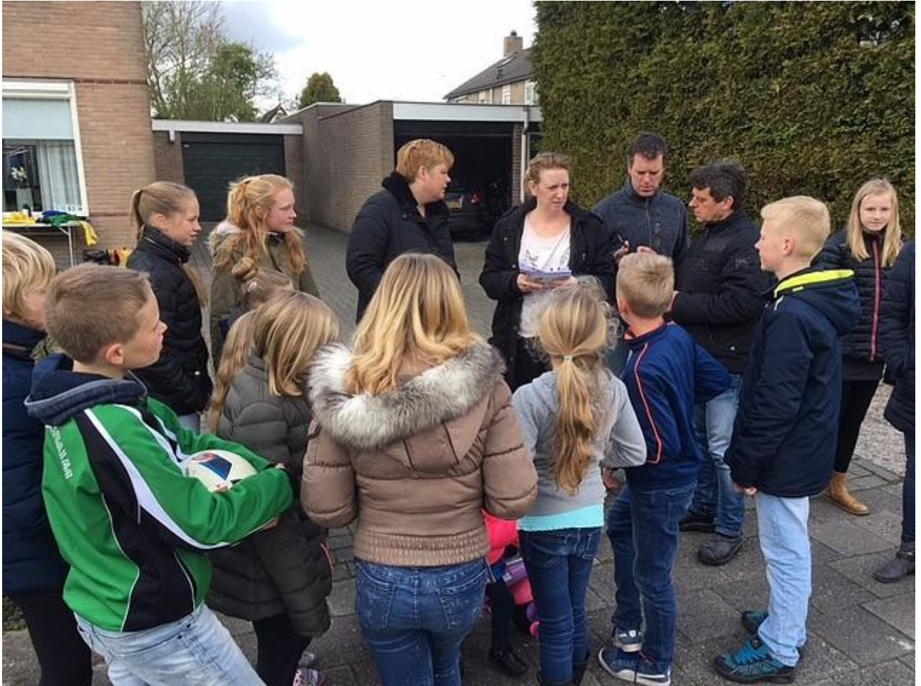
Dit jaar was er dus een foto speurtocht georganiseerd door het hele dorp.