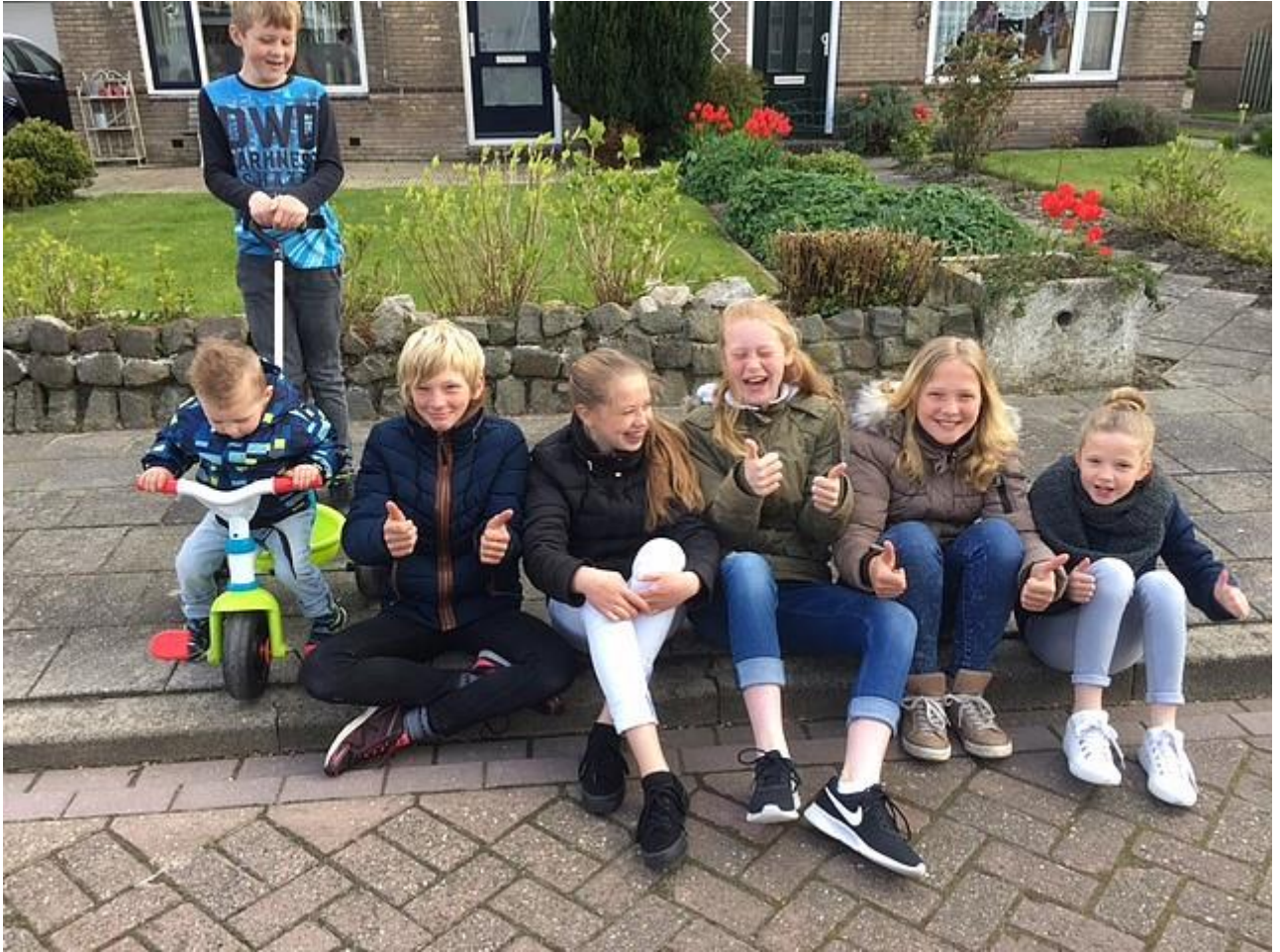
Zo te zien heeft iedereen er zin in