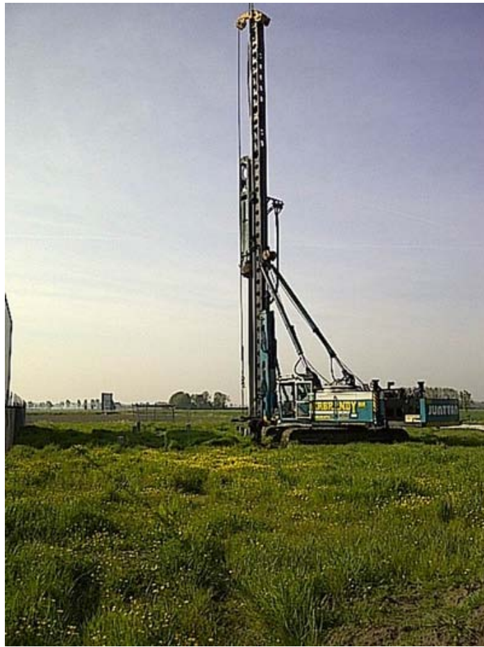
Hier de start van de nieuwbouw in Stiens.