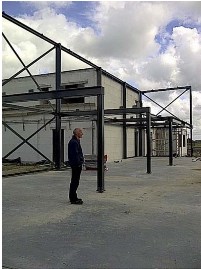
Ja, het begint er al op te lijken.