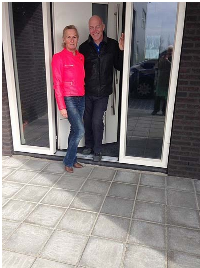
Aan het Seegers te Stiens, en ze zijn er reuze trots op!