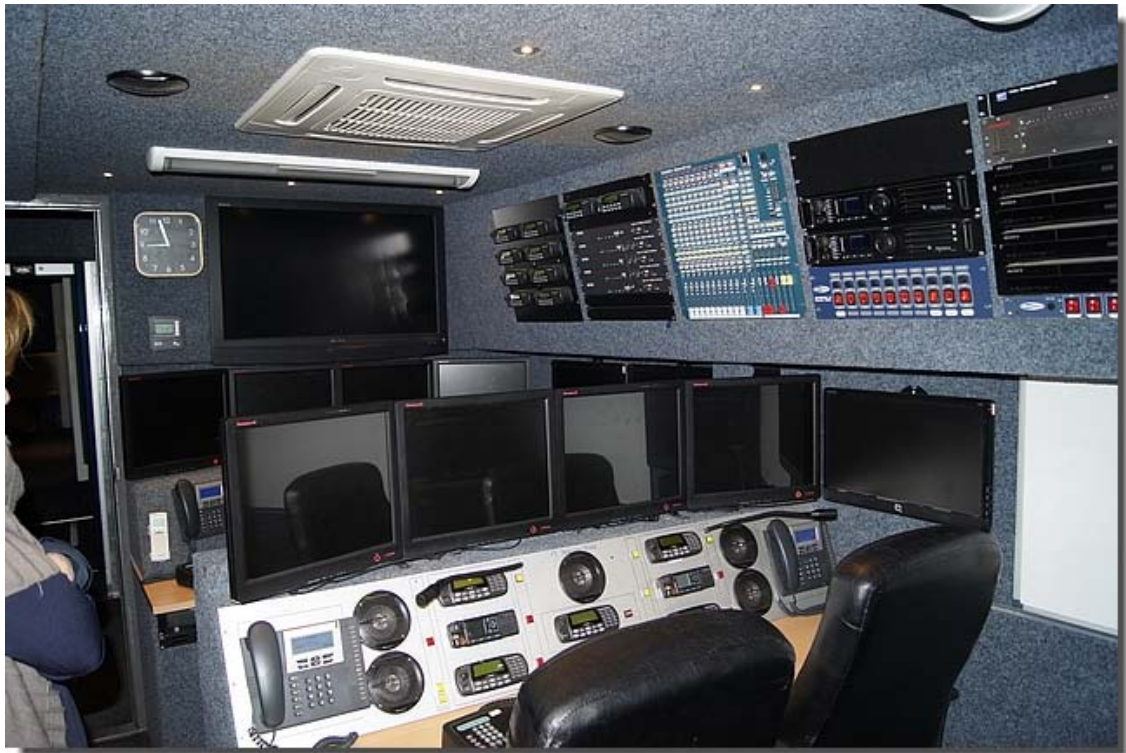
De centrale meldkamer, zowel mobiel als in het kantoor.