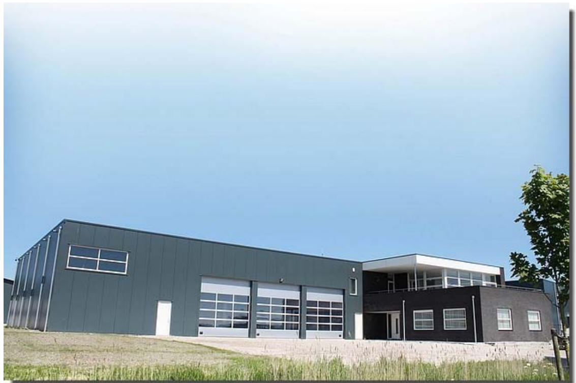
Hier staat het nieuwe gebouw in al zijn glorie.