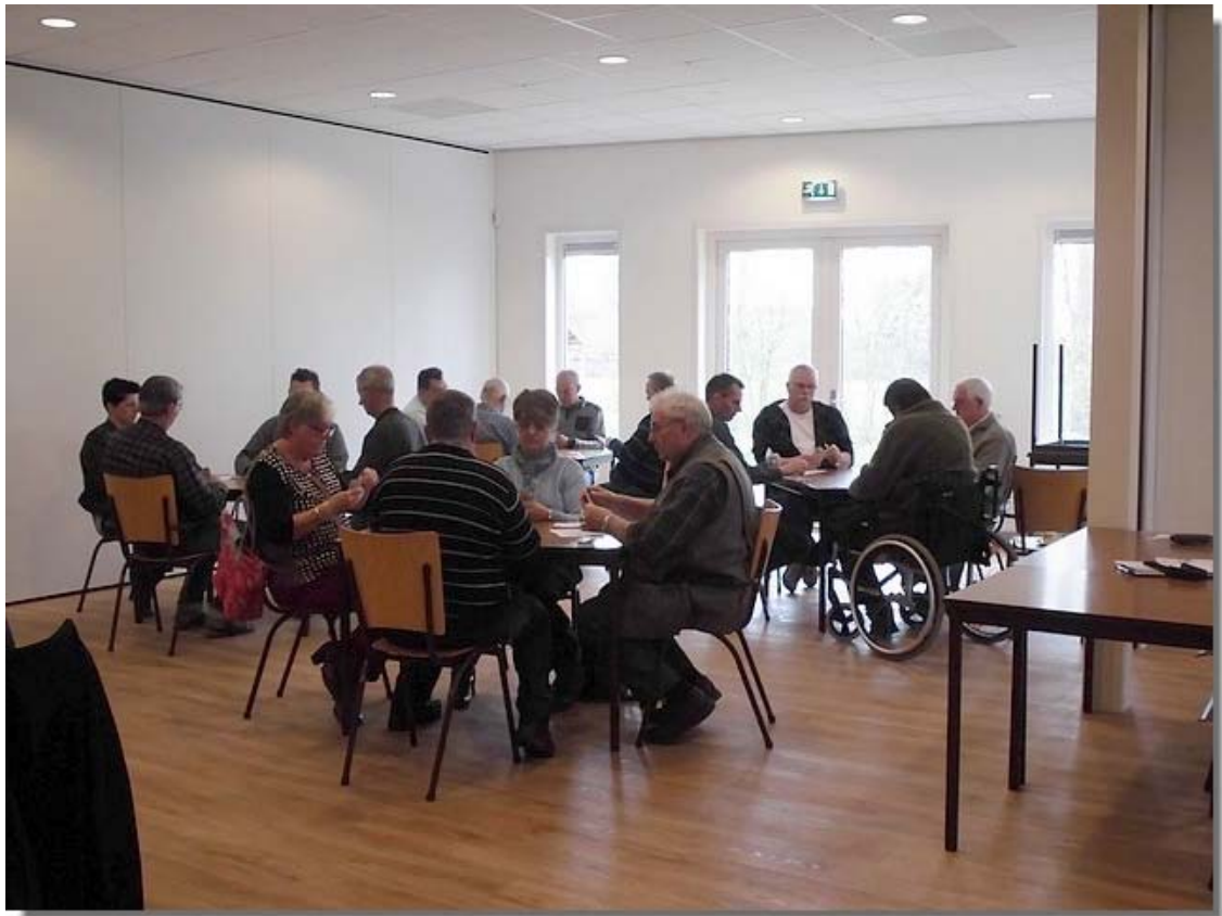
Even later gaat het toernooi van start.