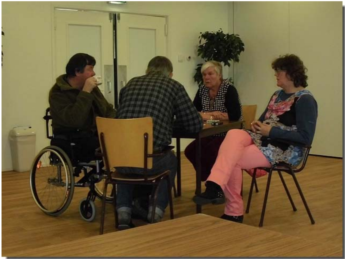
Tijd voor een kopje koffie.