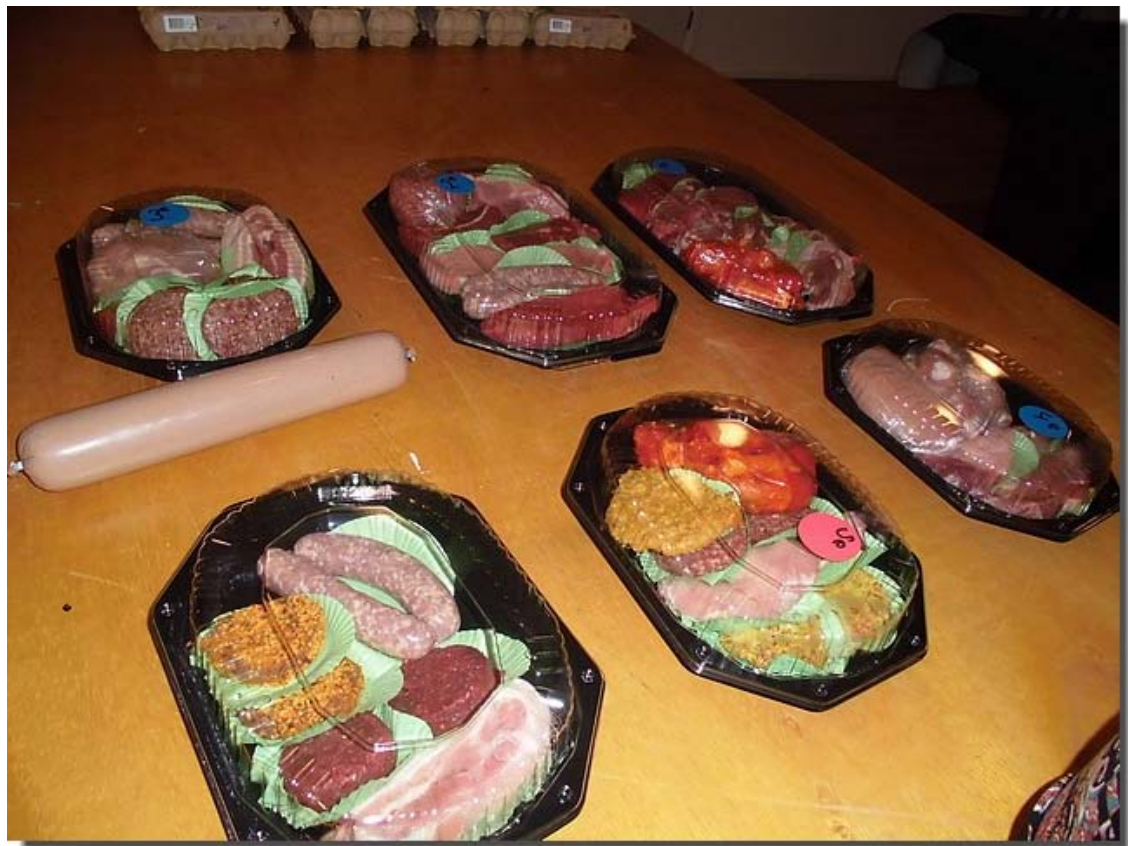
En dan de vleesprijzen.