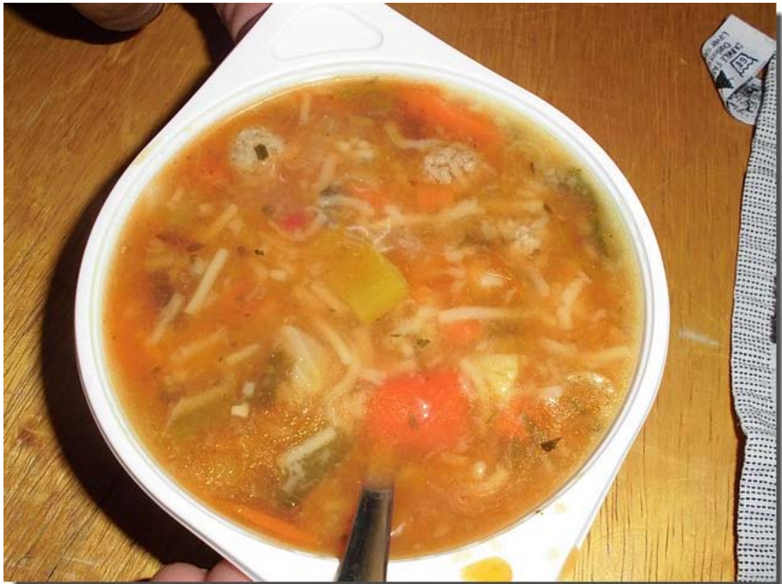
En dat ziet er best goed uit!