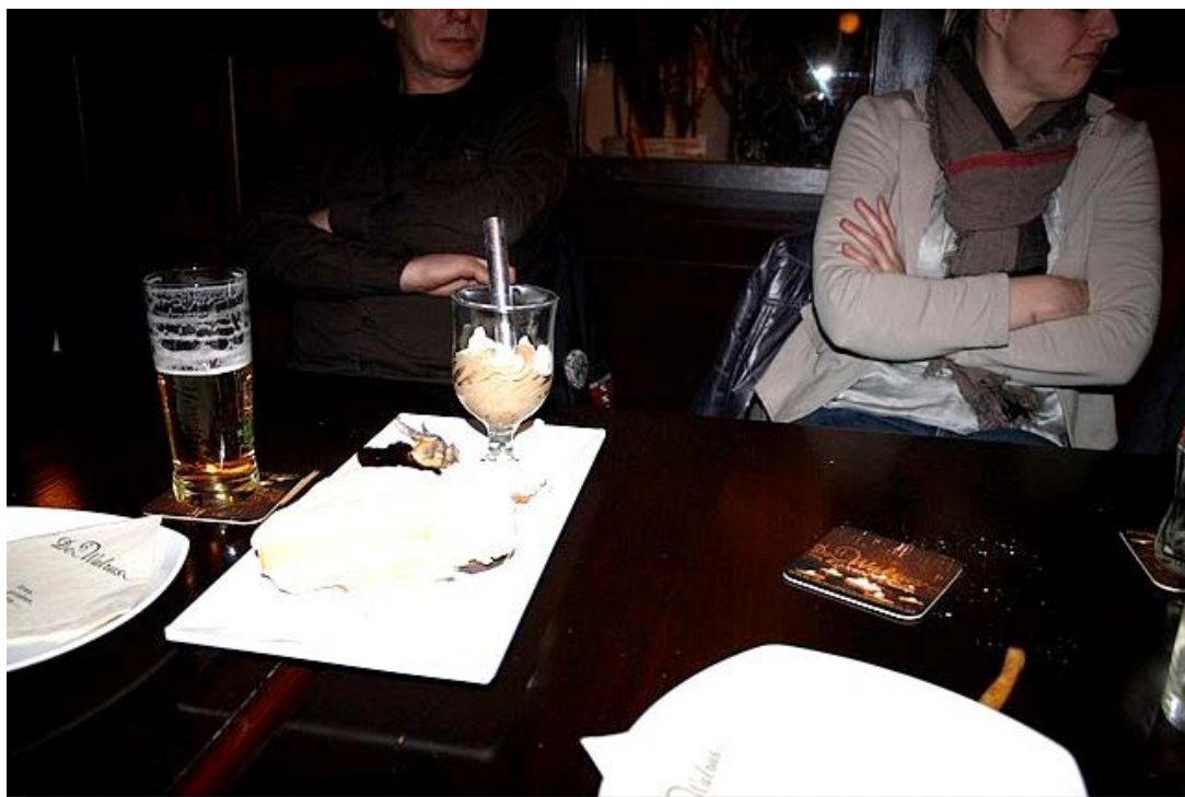
Ter afsluiting kregen we nog verschillende kleine toetjes en ijs. Overal even van proeven.