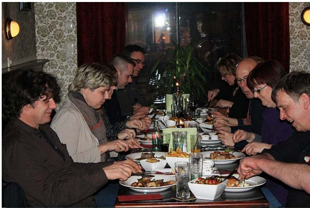
U ziet de redactieleden met aanhang duidelijk genieten.