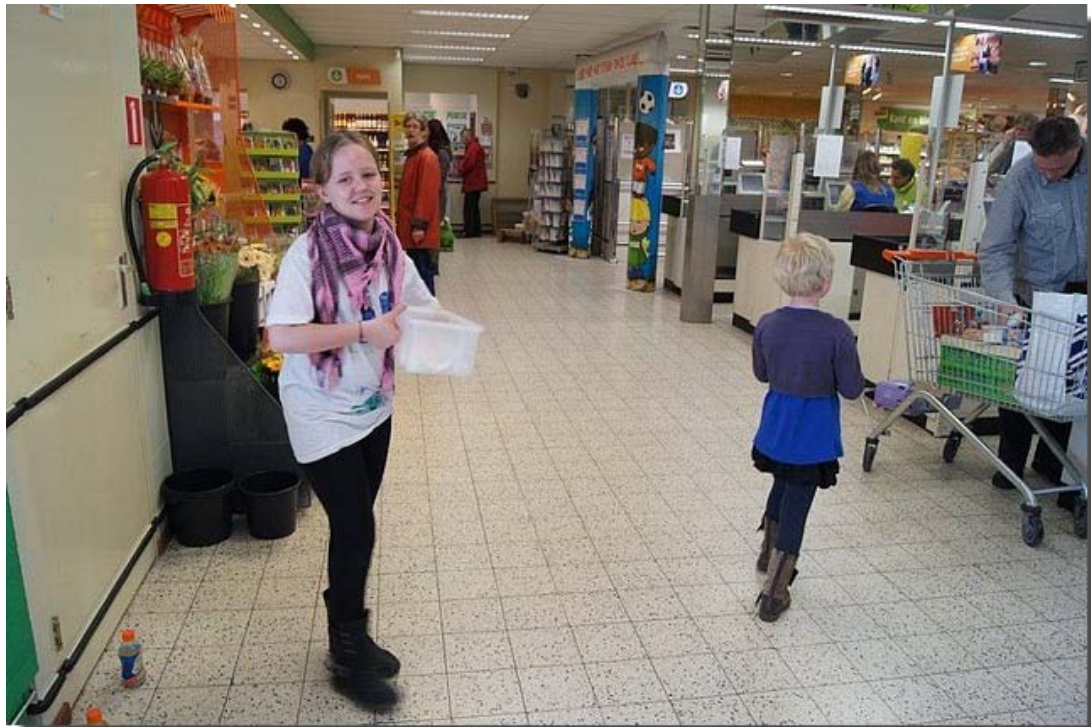
En dus was de Engelumse jeugd vandaag bij de Poesz in Menaldum.

Begin pagina English page Engelum Geschiedenis Dorpsfoto's Kerkklokken Bewoners Dorpsbelang AED info Verenigingen Jeugdclub De oude doos Woningaanbod Sponsors K.v.Sla Raak Museum Fietsroute Links Archief Redactie E-mail Gastenboek