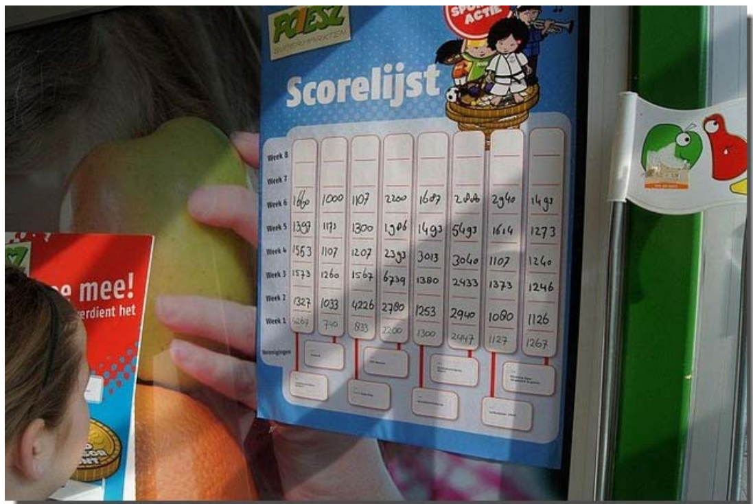
Waar het scorebord nauwkeurig werd bijgehouden.