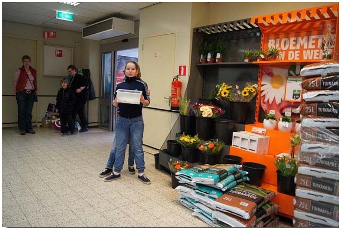
Bij de deur werden spekJes uitgedeeld om de klanten alvast vriendelijk te stemmen.