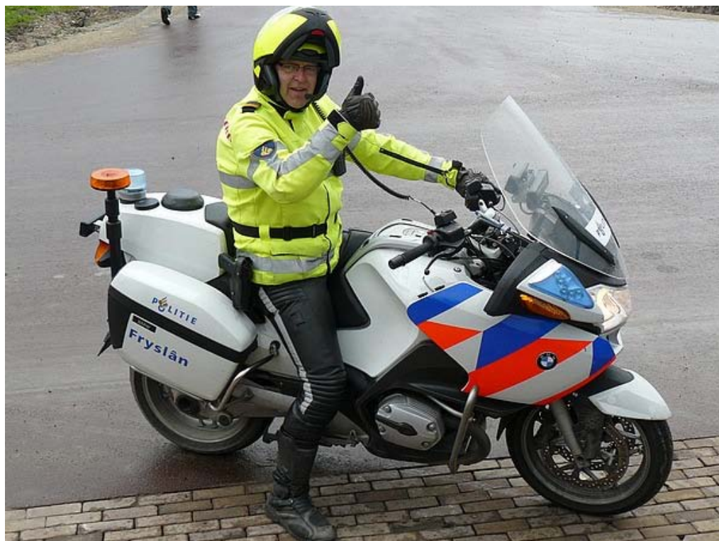
En de politie had alles onder controle.