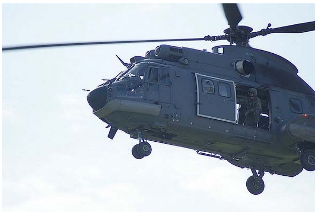
Ook de luchtmobiele brigade was van de partij om een demonstratie te geven.