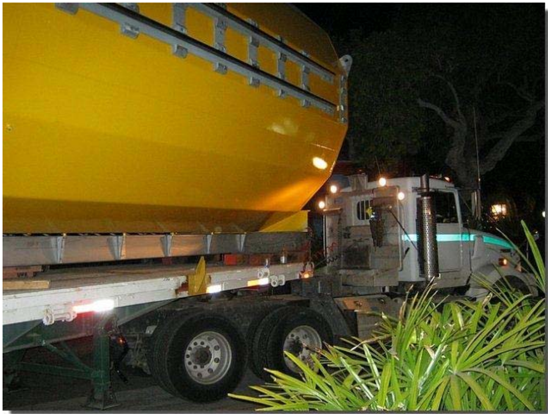
En dat kan soms allemaal maar net!