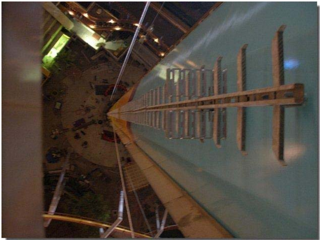
Een kijkje van buiten en van binnen. Je zou er duizelig van worden!