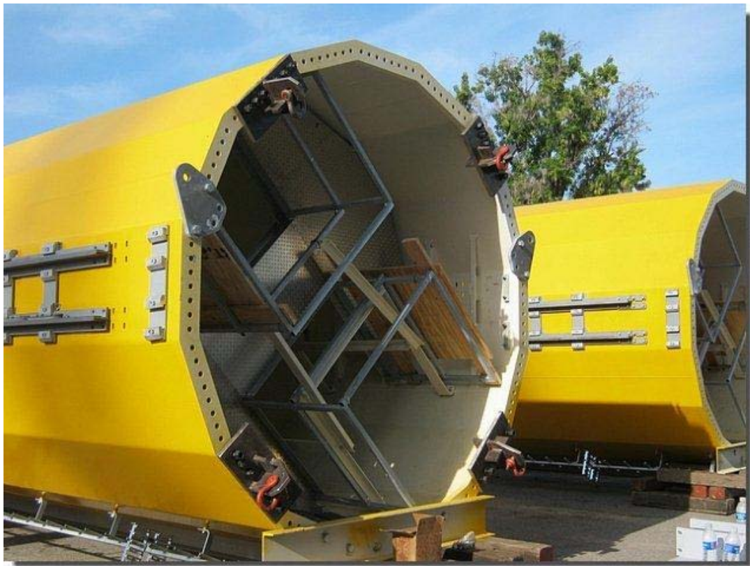
De losse delen liggen klaar om het park in te brengen.