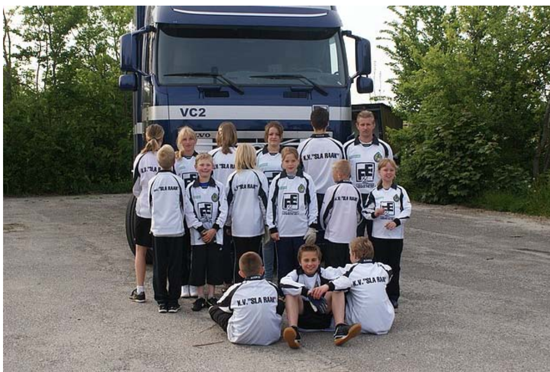
Voor- en achterkant