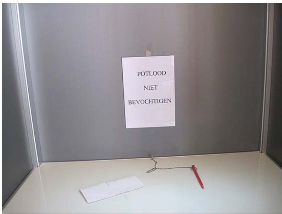
Kon men zijn stem uitbrengen.