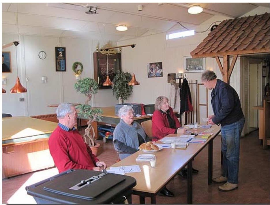
Wanneer de stempas en legitimatie in orde was...