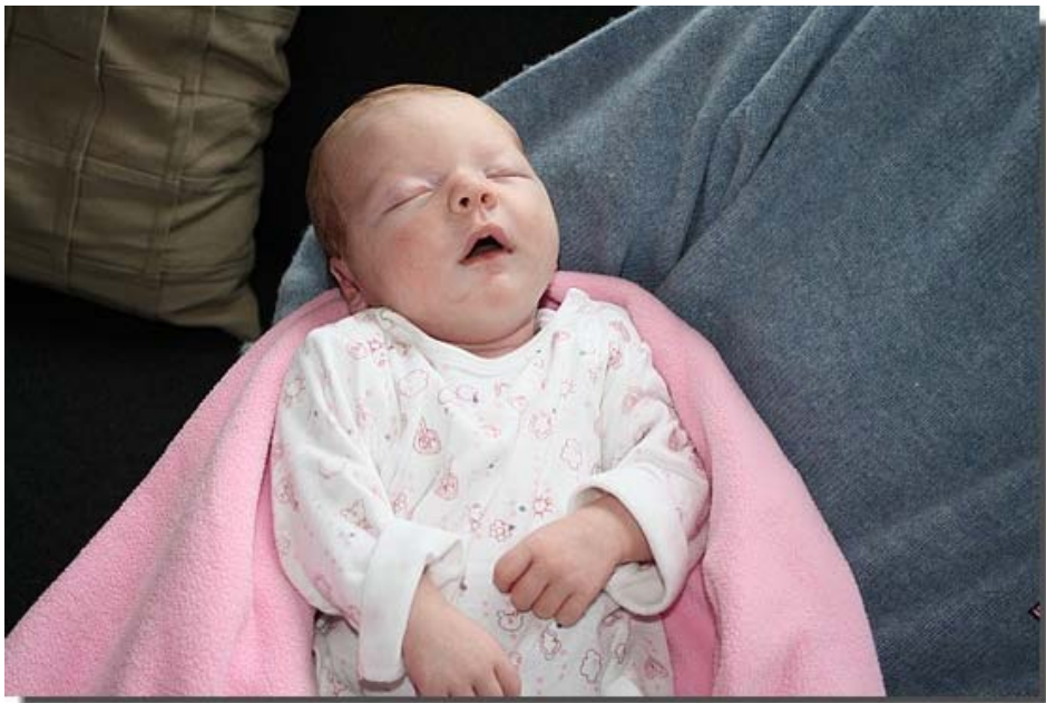
Is het geen plaatje?