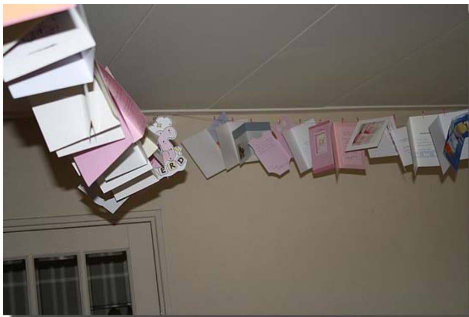
En natuurlijk ook hier vele kaartjes met gelukwensen.