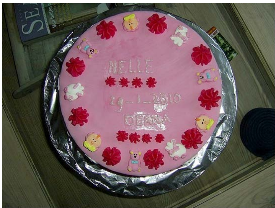
Buurvrouw Riet Hoogveen maakte deze schitterende en vast overheerlijke taart.