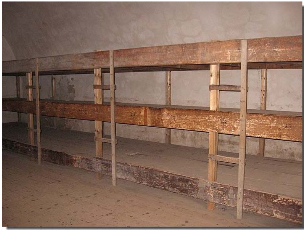
In deze kleine barak sliepen zo'n 200 mensen, allemaal met het hoofd naar voren vlak naast elkaar.