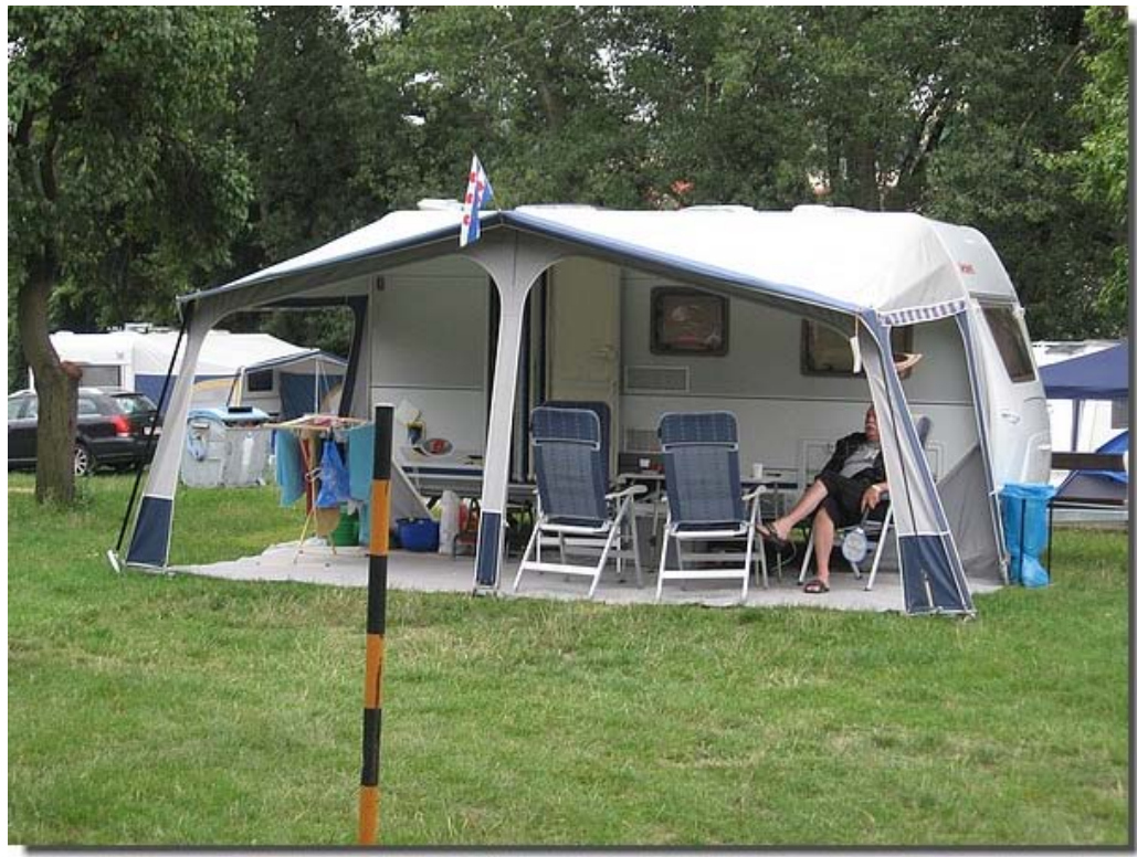
En Cor en Wieke hebben de Friese vlag in top.