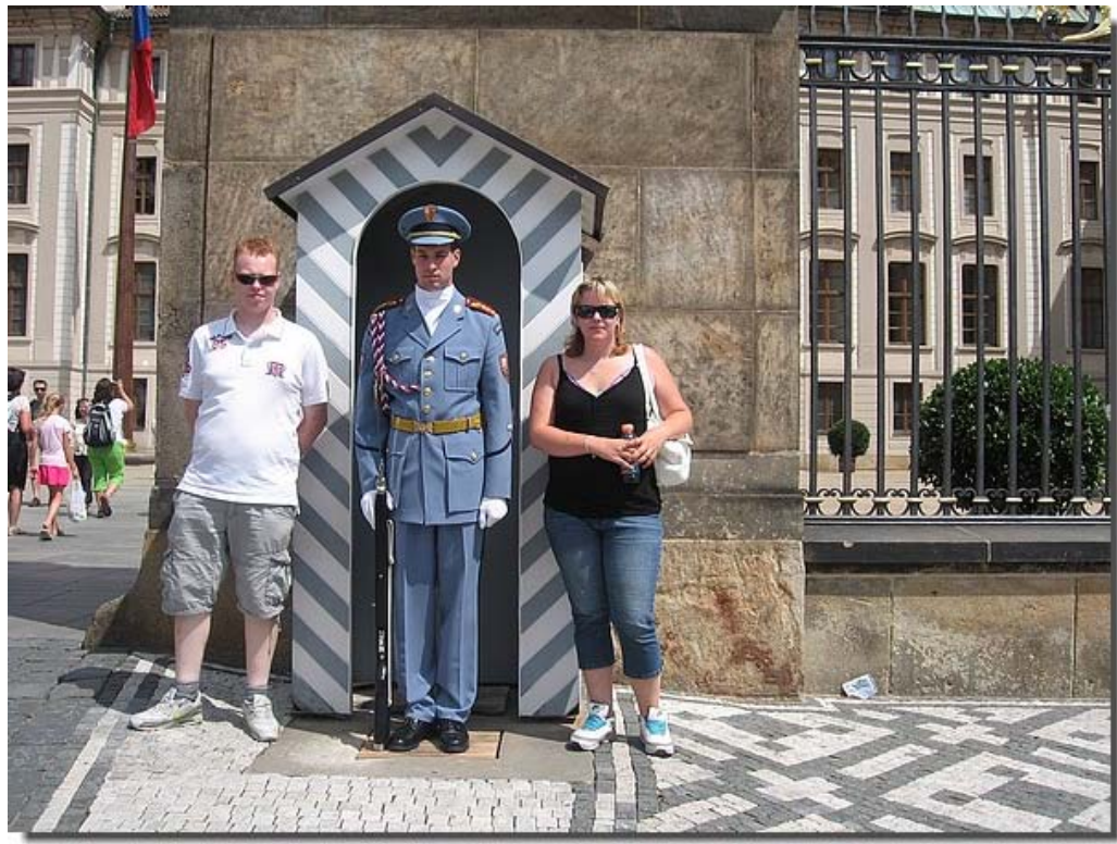
En de wacht, die met een hele hele show s'middags om twaalf uur wordt gewisseld.