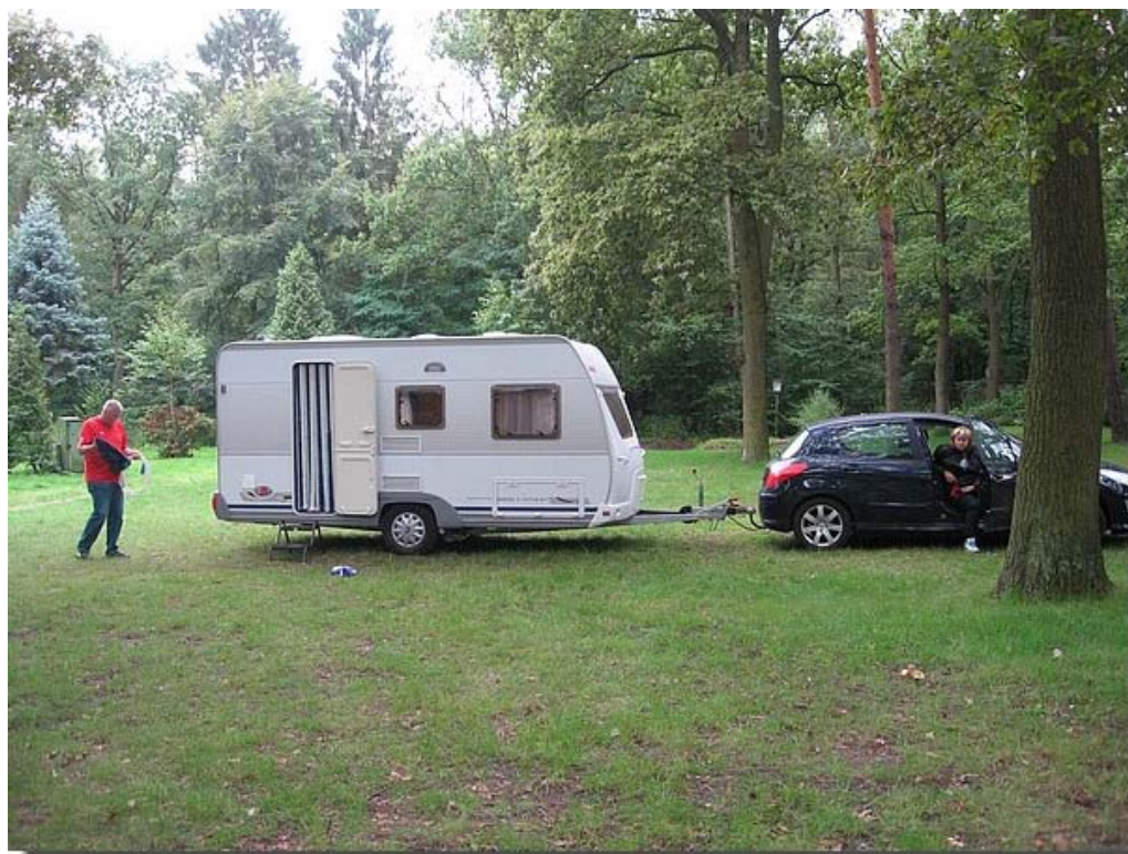
En dan weer terug naar Engelum, om het dagelijkse leven weer op te pakken.