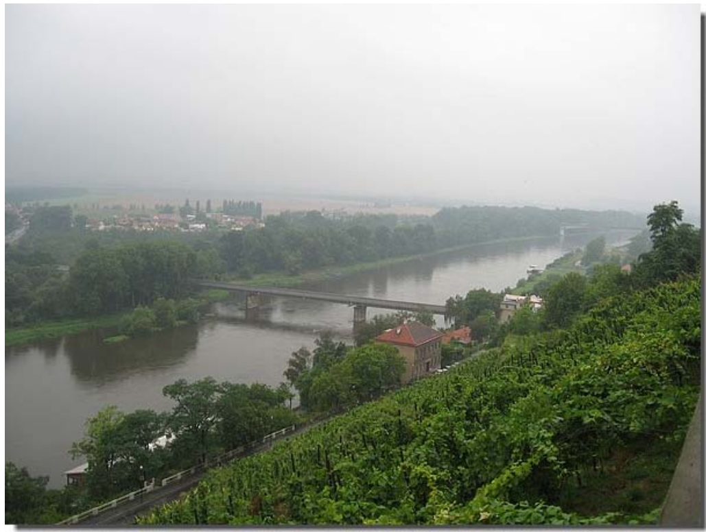
De Elbe in Melnik.