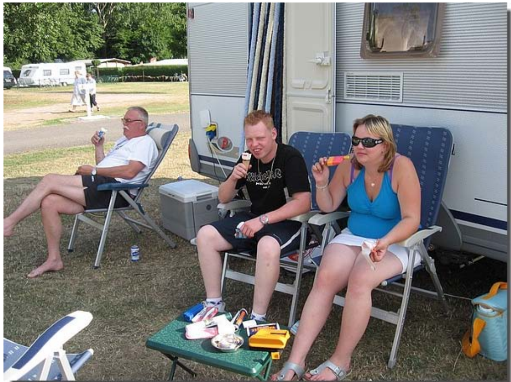
En hier zit de familie al lekker in Magdeburg Duitsland, waar ze een nacht verbleven.