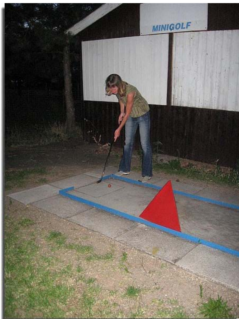
Maar er was natuurlijk ook tijd voor ontspanning.