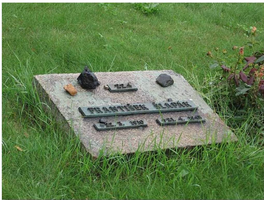
Op deze begraafplaats geen kruisjes maar op elk graf liggen gedenksteentjes.