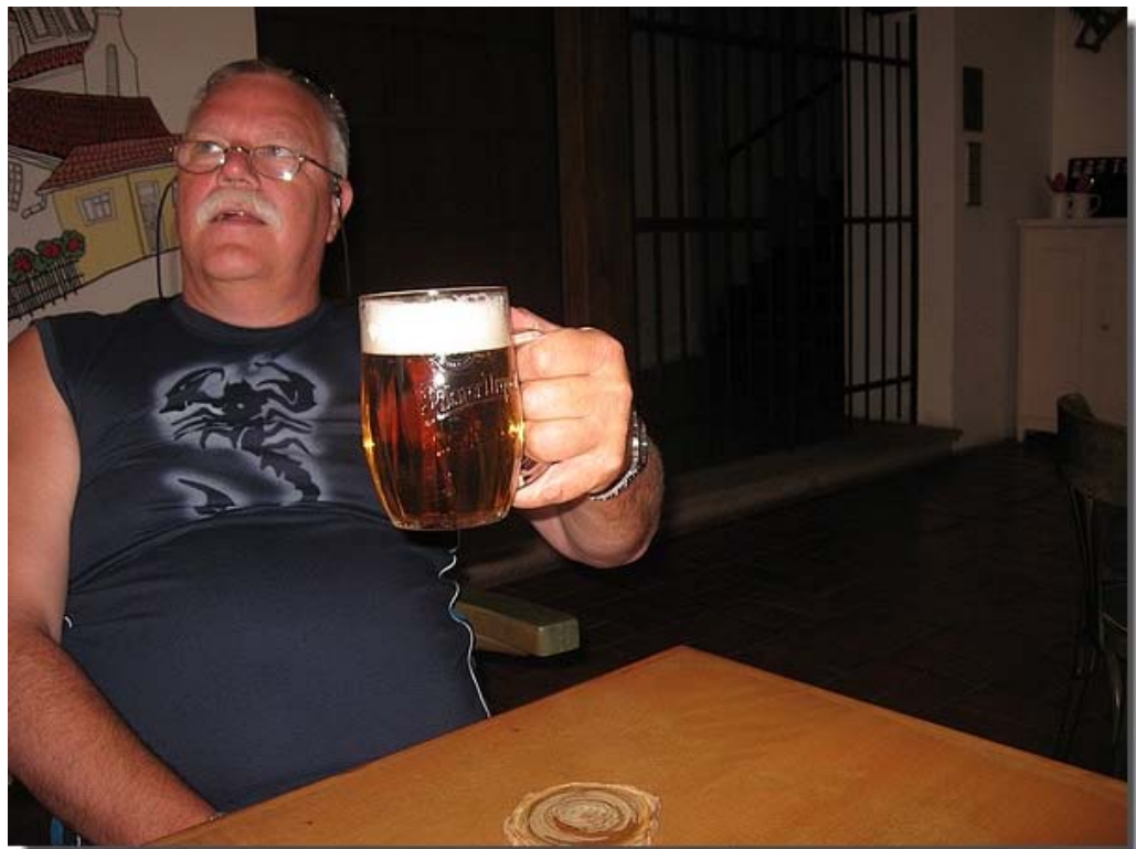
En een pul bier voor een Euro; wat wil je nog meer!