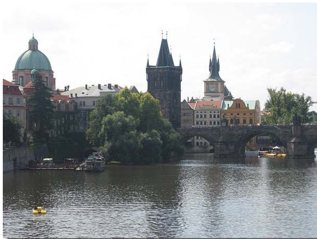
De mooie stad Praag, met de karlsbrug.

Begin pagina English page Engelum Geschiedenis Dorpsfoto's Kerkklokken Bewoners Dorpsbelang Verenigingen Jeugdclub De oude doos Woningaanbod Sponsors K.v.Sla Raak Museum Fietsroute Links Archief Redactie E-mail Gastenboek