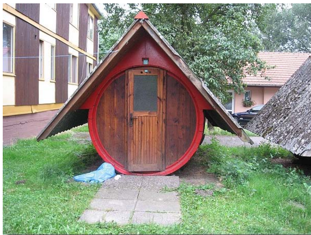
De slaappleafts van Johan en Doeina; een oud wijnvat. Is het niet prachtig?