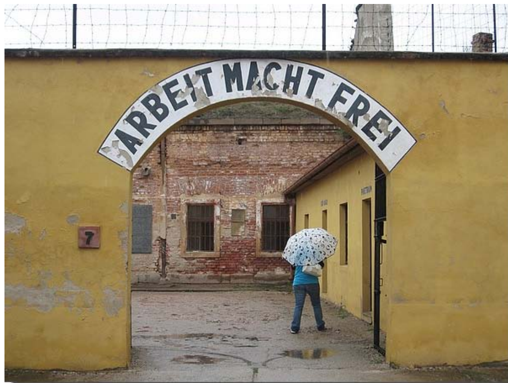
De ingang van het museum.