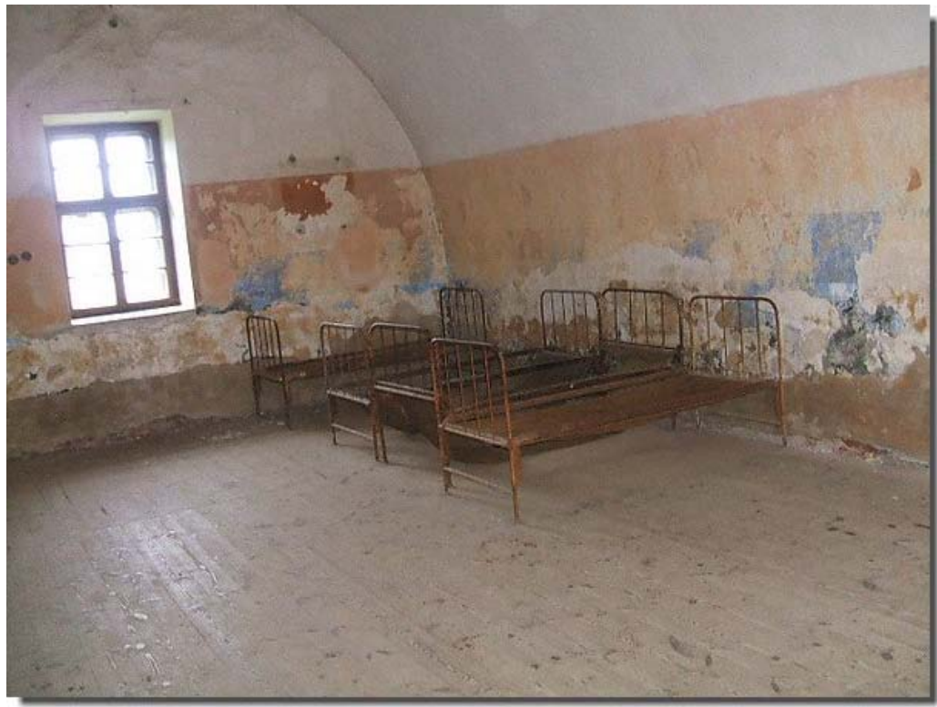
In de ziekenboeg had men wat meer comfort.