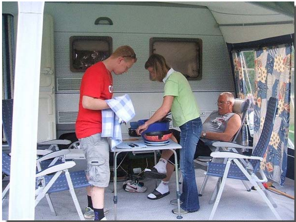
De eindbestemming; de camping in Melnik.