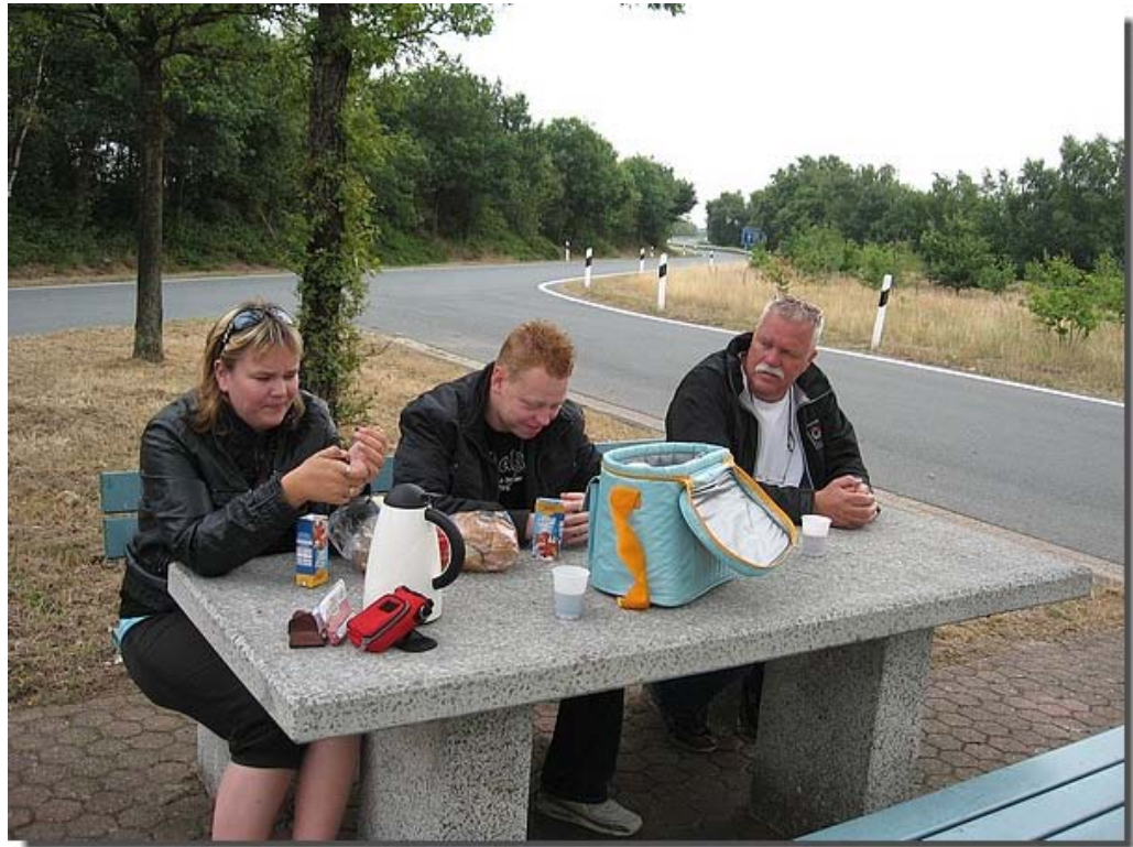
Onderweg bij Oldenburg even een tussenstop.