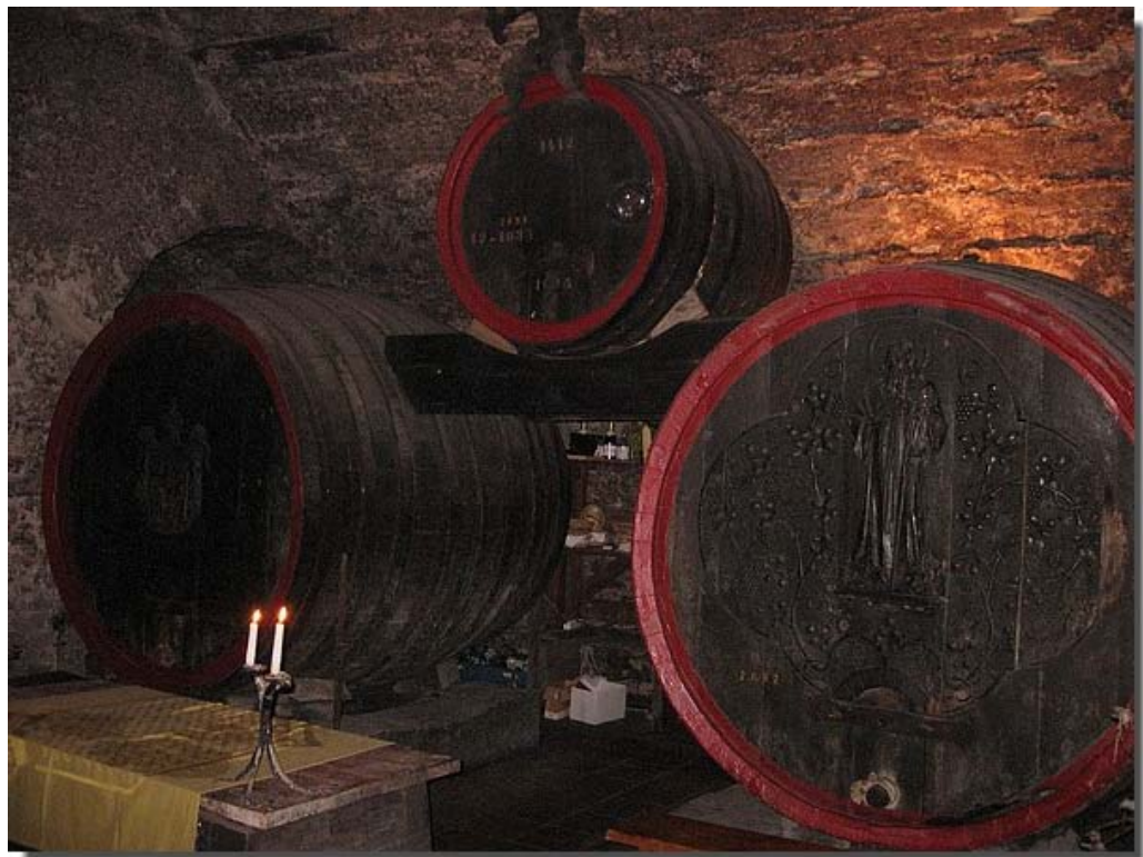
Ook kon men wijnproeven in Melnik.