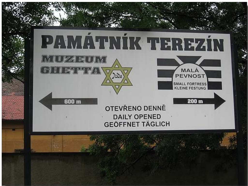
Ze bezochten daar ondermeer het Concentratiekamp Terezin.