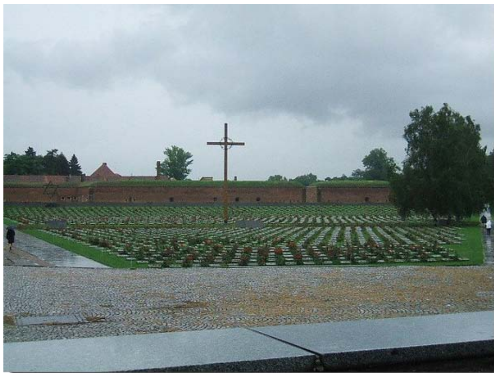
Met de indrukwekkende begraafplaats.