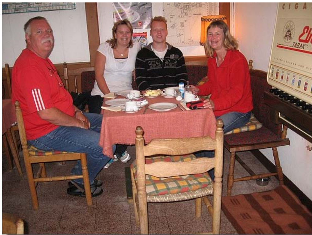
En dit is dan alweer op de terugweg. Een ontbijtje in Duitsland.