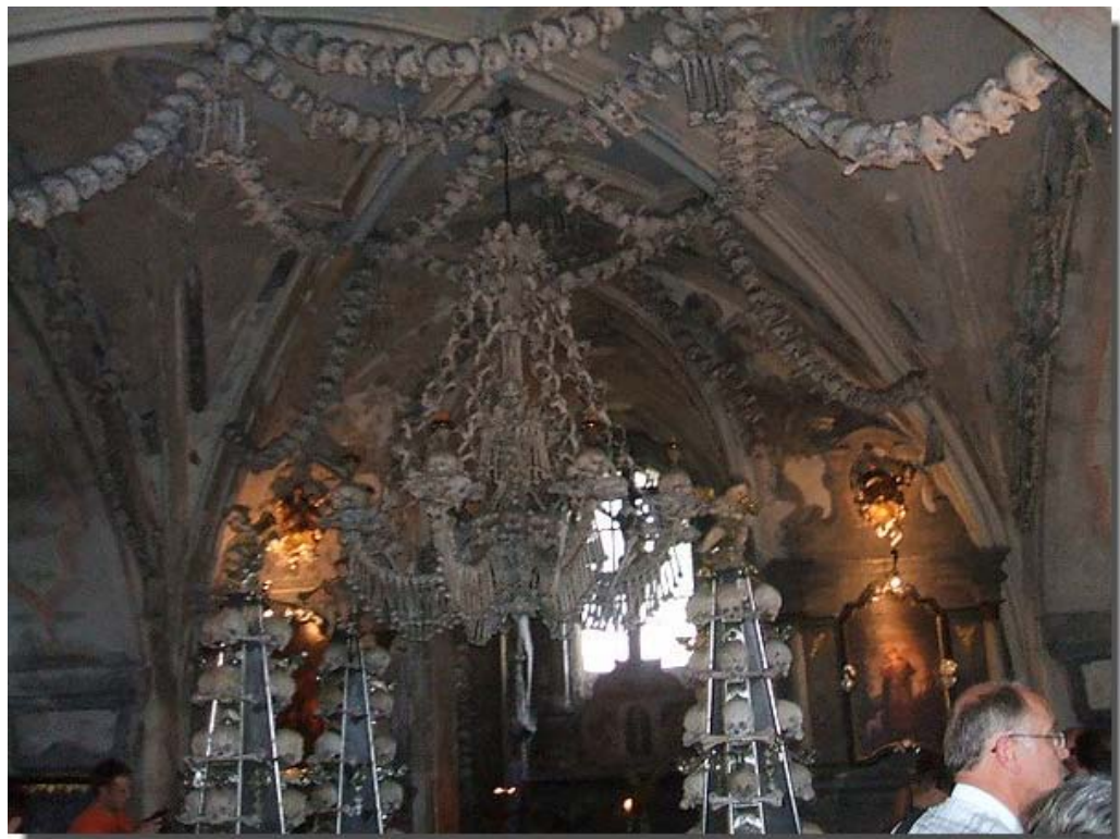
Ook bezochten ze de Kerk in Kostnice.