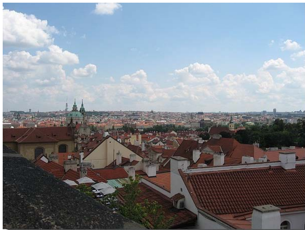
Uitzicht over Praag