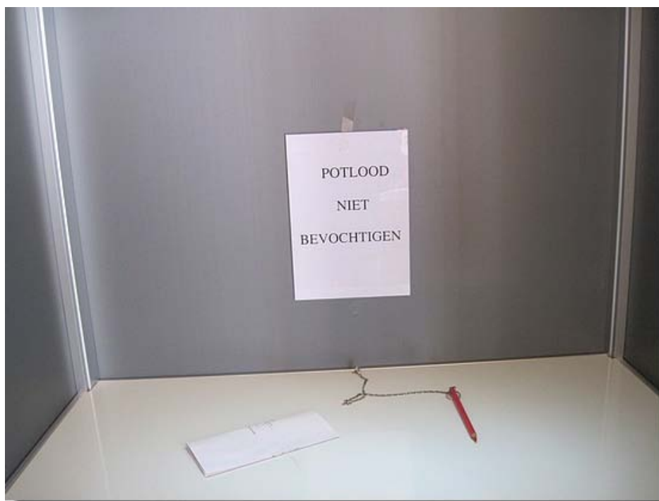
Kon men zijn stem uitbrengen.