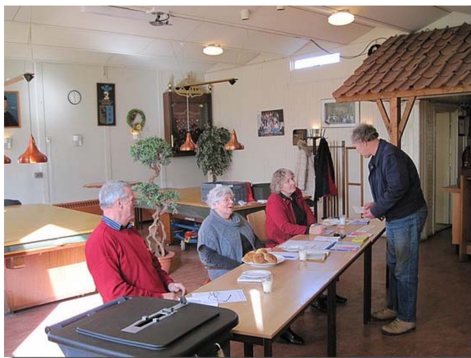
Wanneer de stempas en legitimatie in orde was...