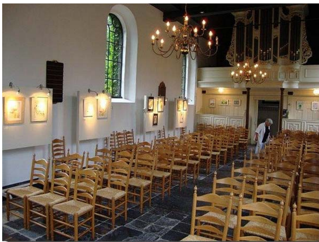
Klaske geeft sinds 1995 les in aquarelleren en tekenen in haar atelier “by klas”. En sinds 2007 geeft ze les aan de groep “vrouwen van nu” in Marssum.