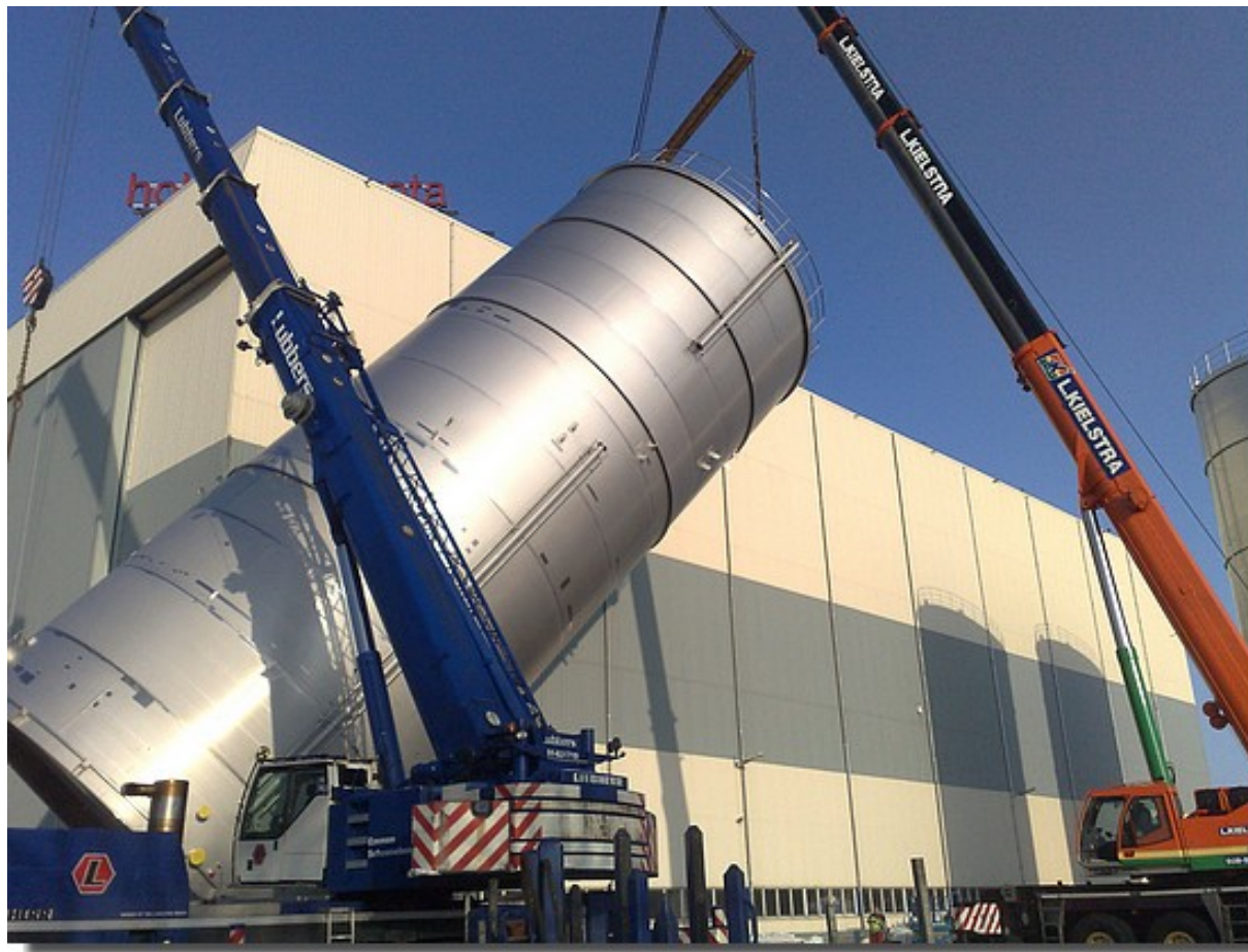
Locatie Holvrieka Sneek, opdrachtgever Pax bouw en industrieservice.