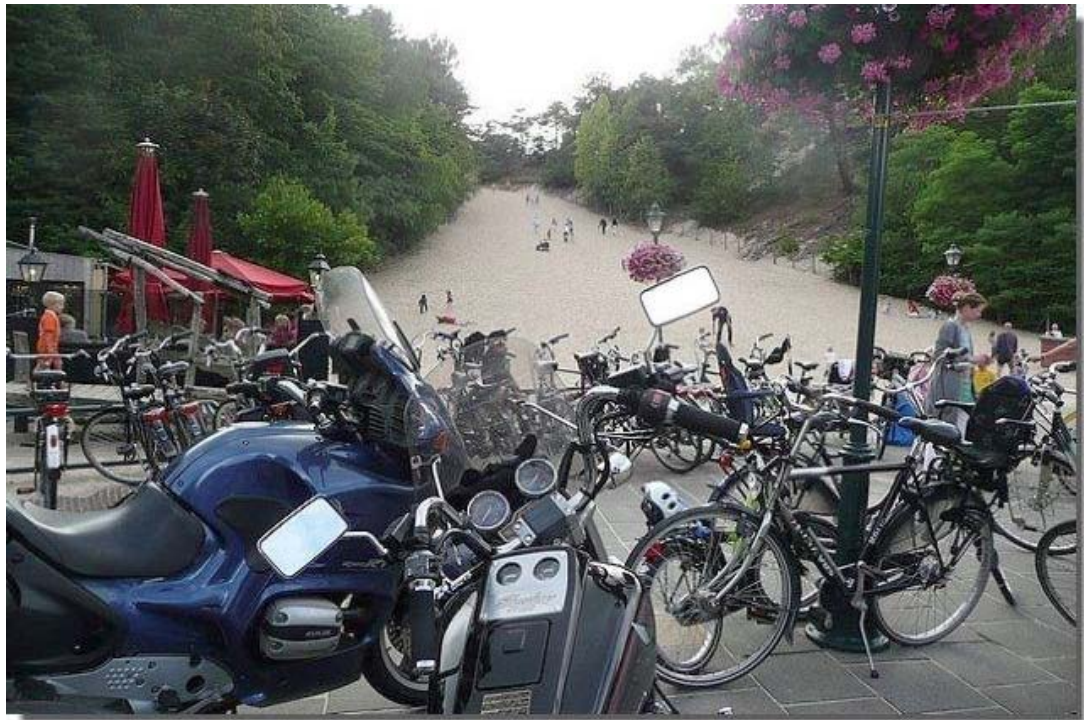
En op de terugweg een kopje koffie drinken op het terras in Schoorl.