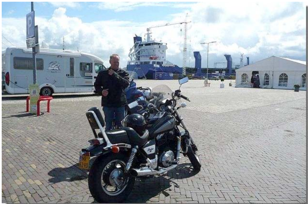
De eerste pitstop voor de motorrijders en om de tank weer vol te gooien.