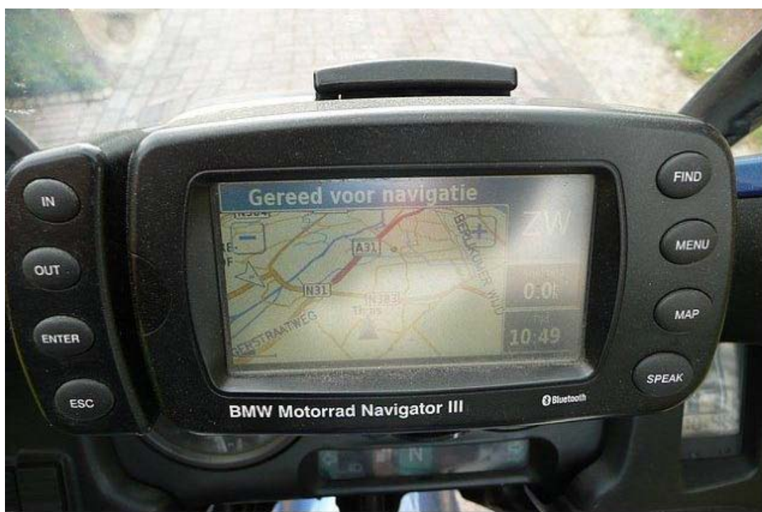
En verdwalen is er niet bij!