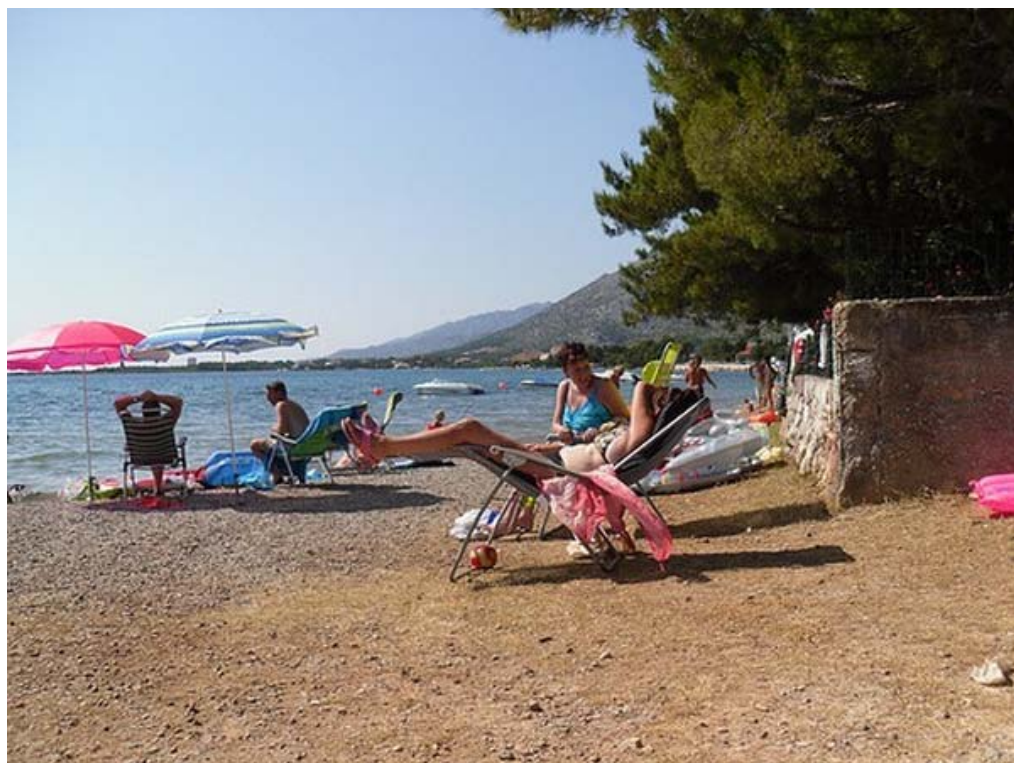
Dan begint de vakantie pas echt.