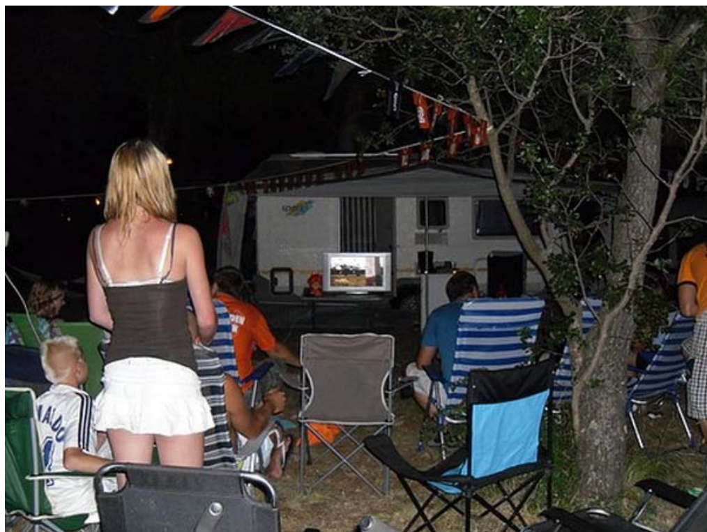
Maar ook hier volgt men het Nederlands elftal op de voet.