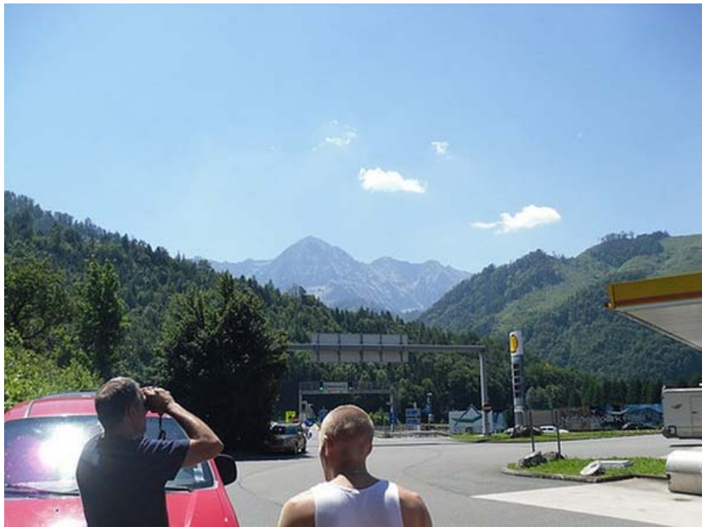
En dit begint er al op te lijken!