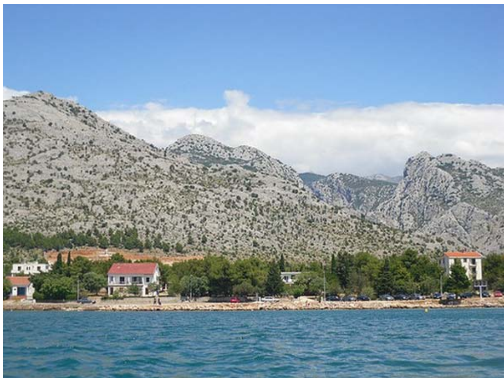
En dit is hun eindbestemming.