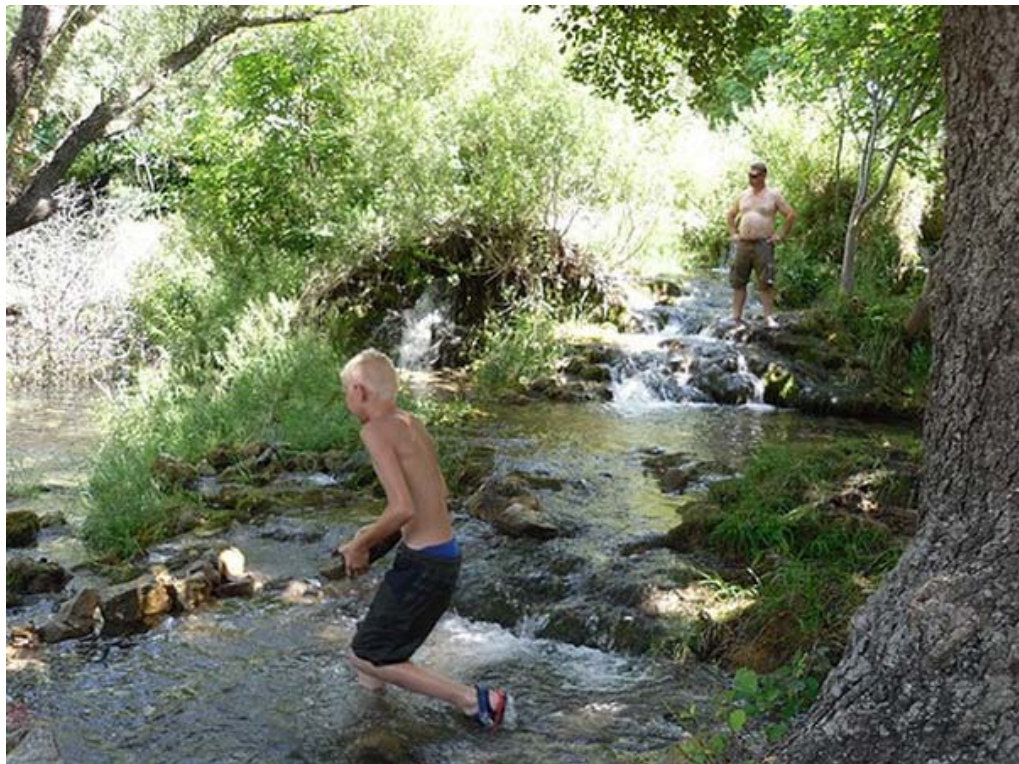
En verder vind je verkoeling in kleine beekjes.