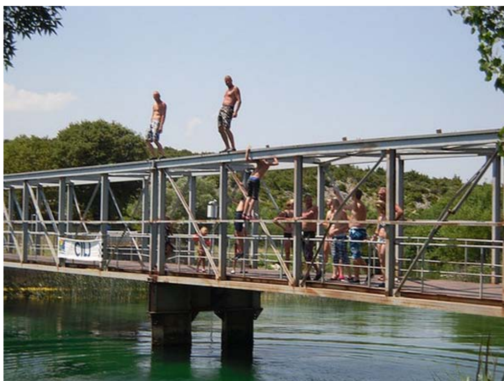
Ook in Kroatië wordt er van bruggen gedoken.