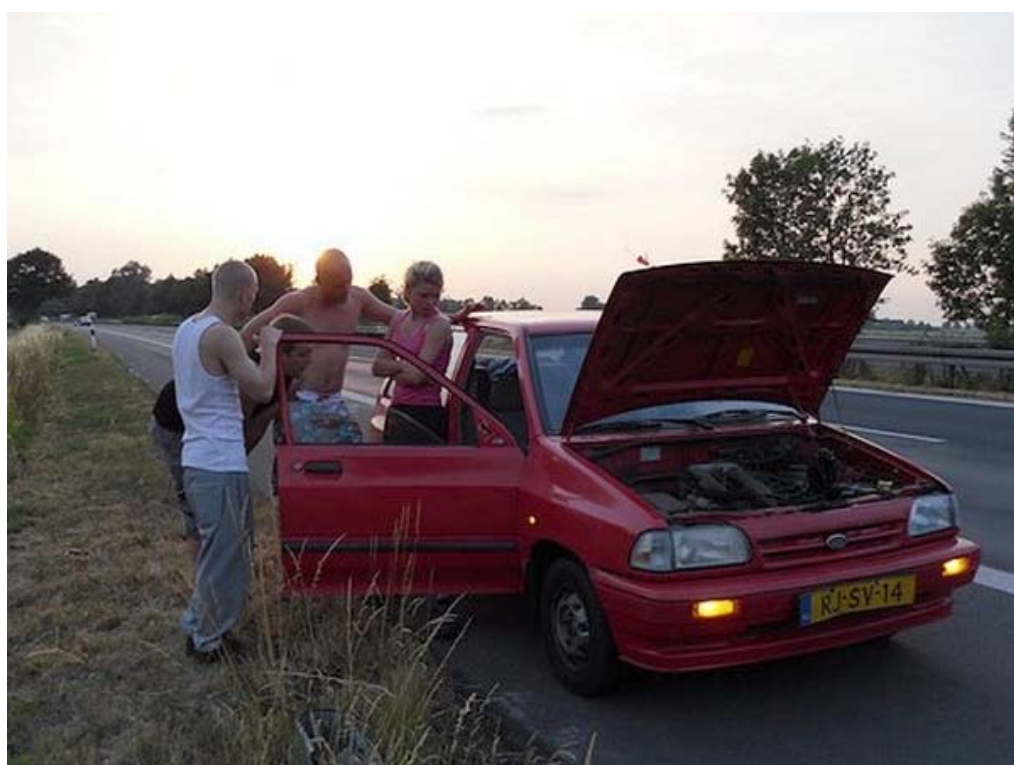
Onderweg werden ze nog wel even geplaagd door pech maar het was en het bleef een zeer geslaagde vakantie!

Onze site wordt mede mogelijk gemaakt door: