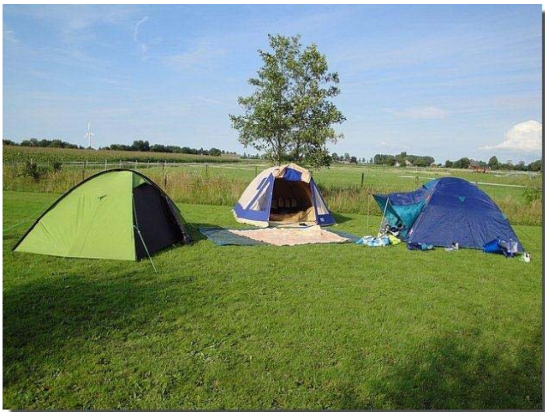
Later op de middag arriveren ook Kirsten en Sigrid. Dan is de groep is compleet.