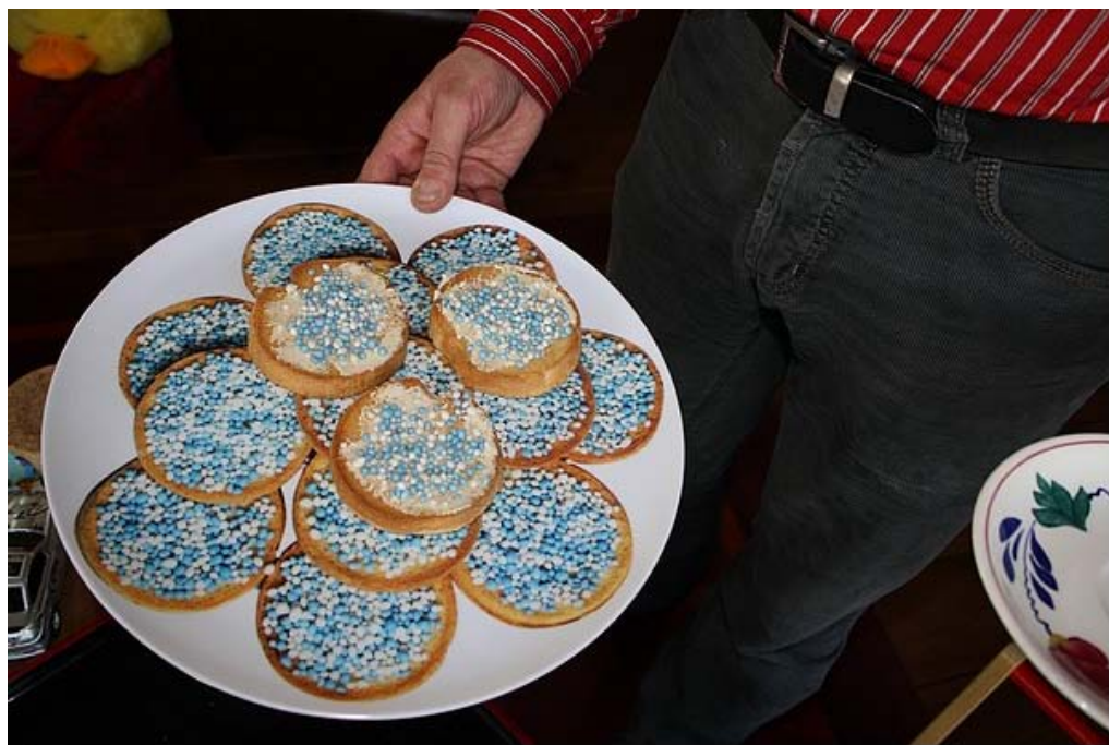
En natuurlijk waren er bij dit kraambezoek beschuit met muisjes!