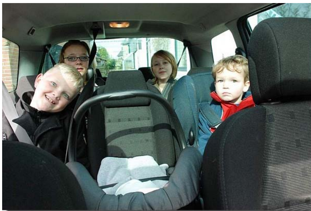
Ja, dat wordt een hele auto vol!