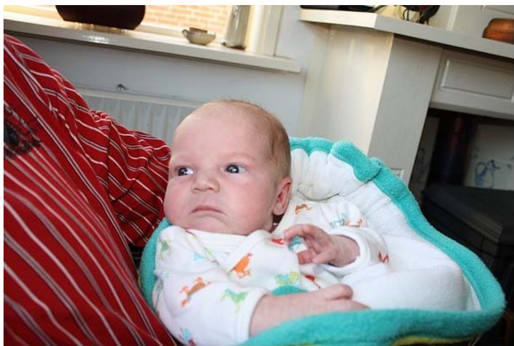
En hier is hij dan in eigen persoon.