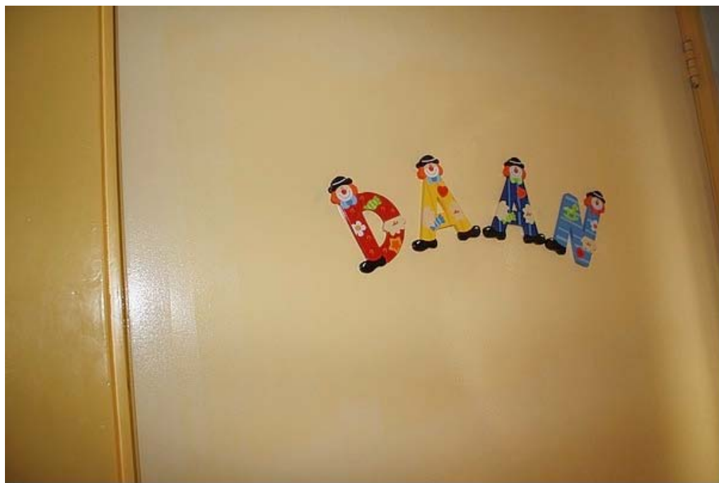
Dan nog even naar de kamer van Daan.