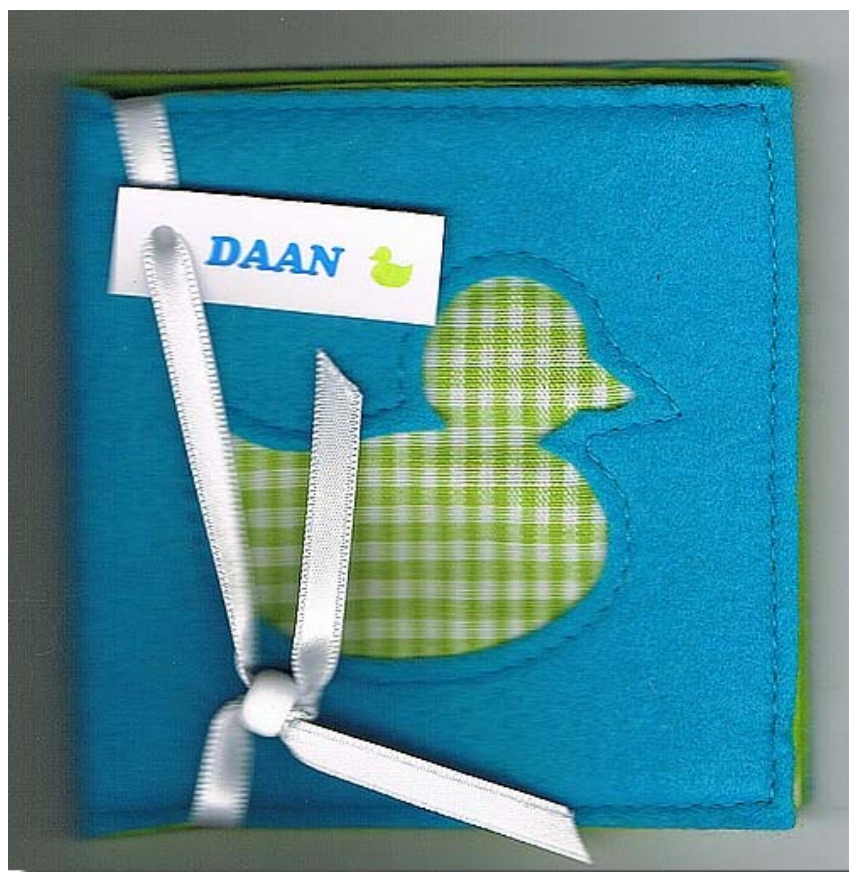
Ook het kaartje was weer erg leuk en bijzonder.