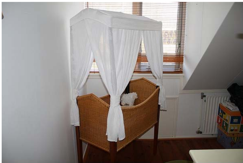
Daar staat zijn prachtige wieg.