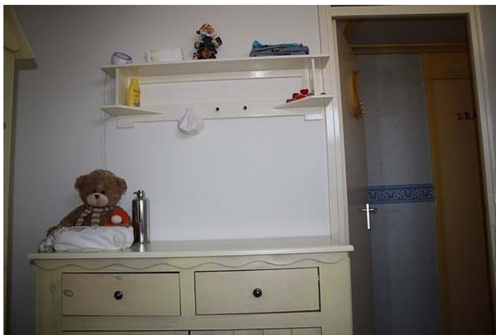
En de werkplek van moeder Trea zullen we maar zeggen.