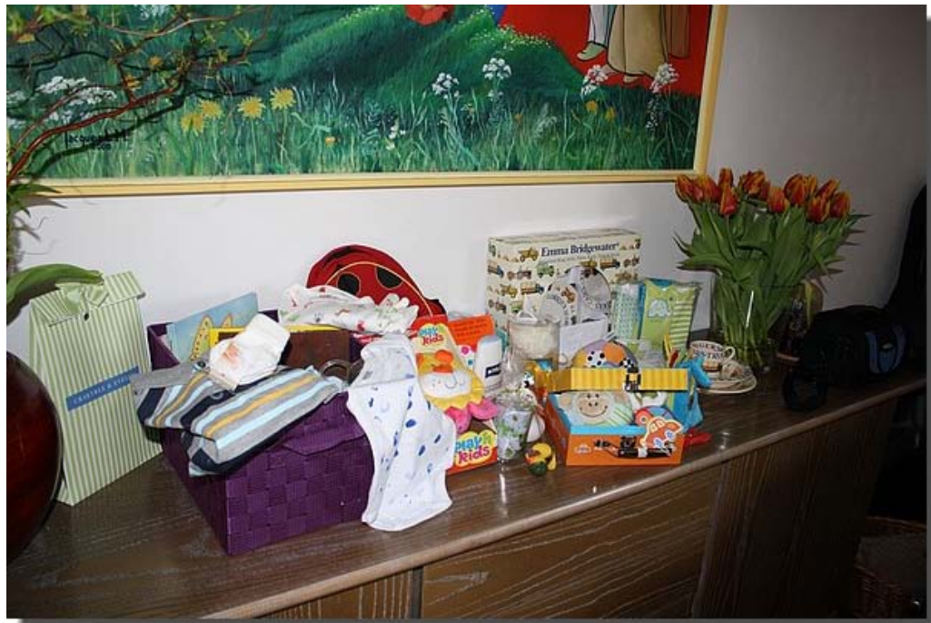
En vele cadeaus.