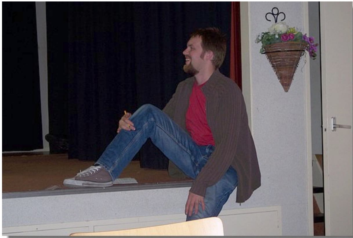
Us nije regisseur Wouter van der Wal.