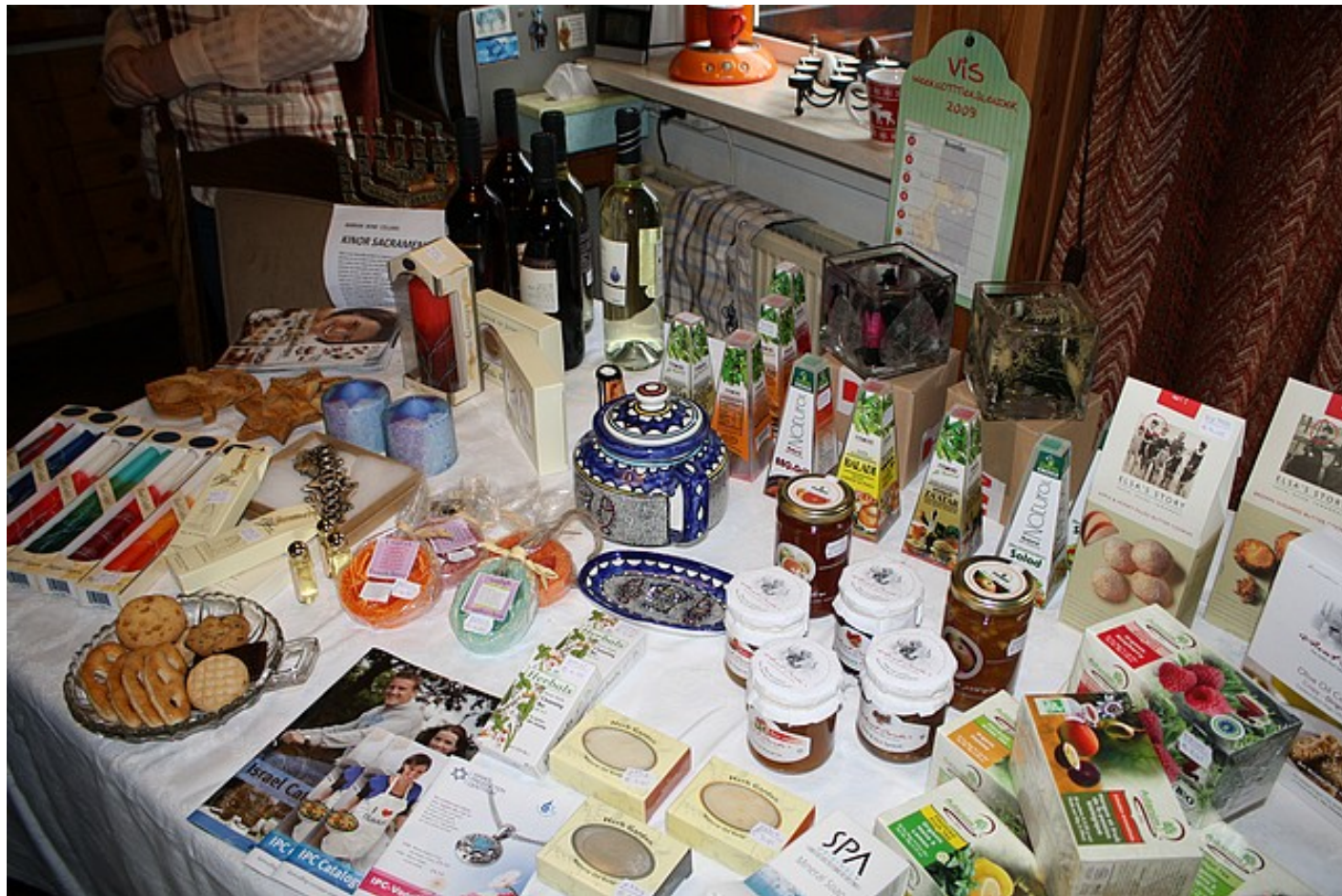
Echt te veel om op te noemen