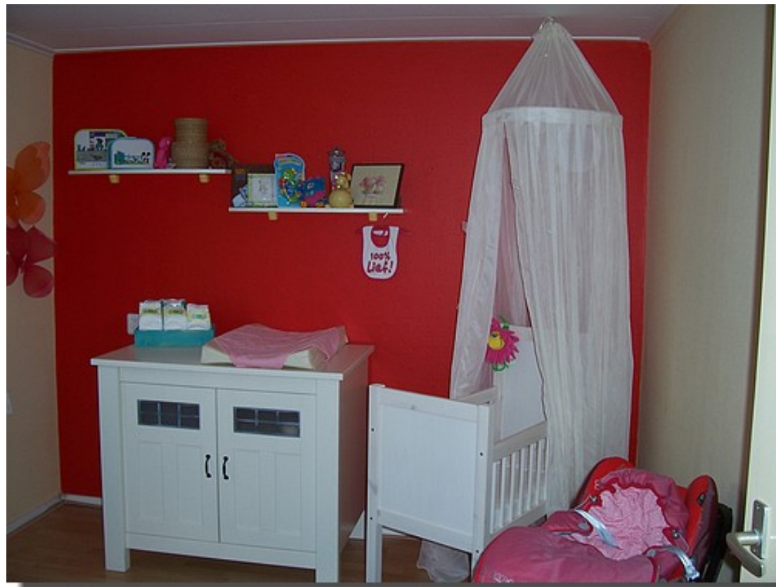
Haar prachtige kamer.