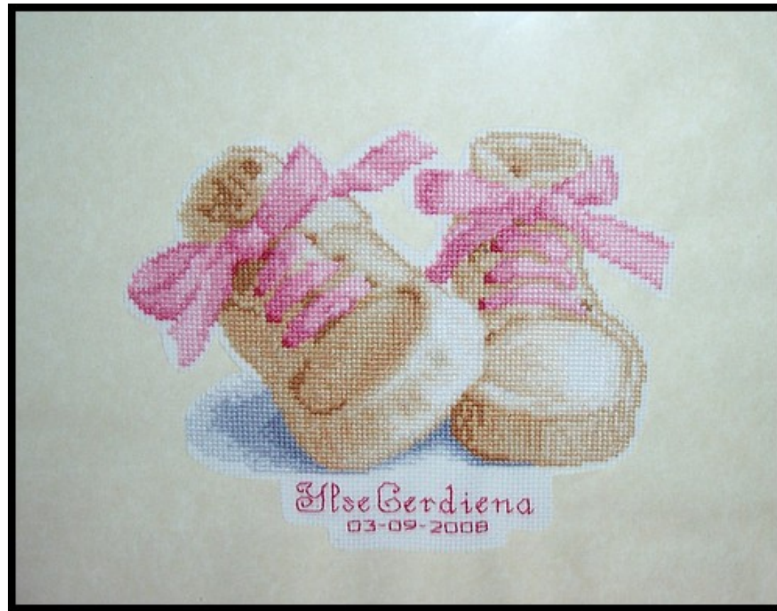
Een schitterend borduursel gemaakt door Paula's schoonzus Geertje aan de wand.