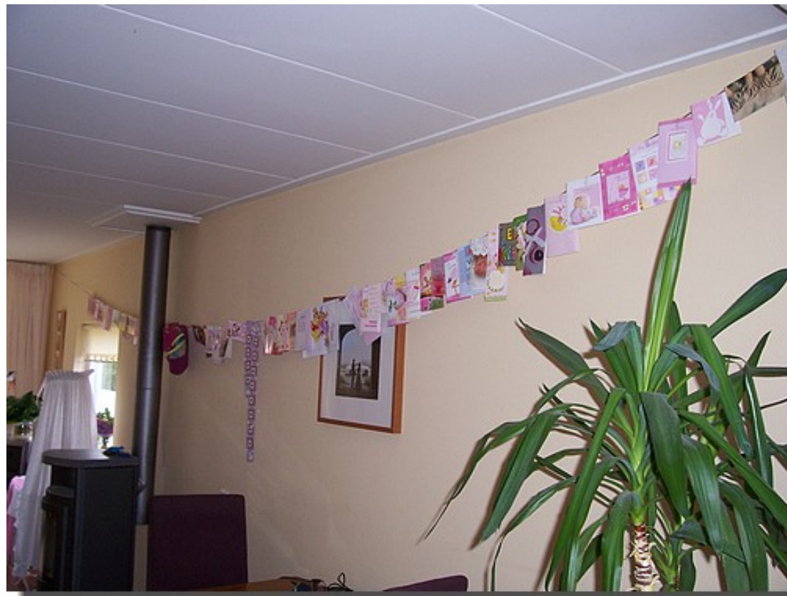
De kamer was versierd met kaartjes.