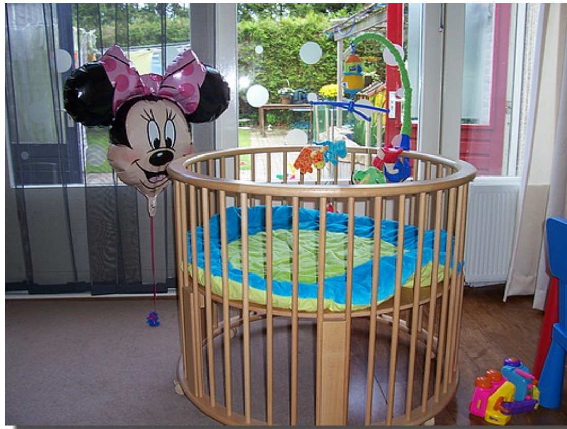
Ook de mooie ronde box stond al klaar.