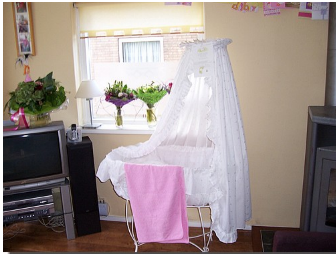
En de blikvanger in de kamer was natuurlijk de wieg.