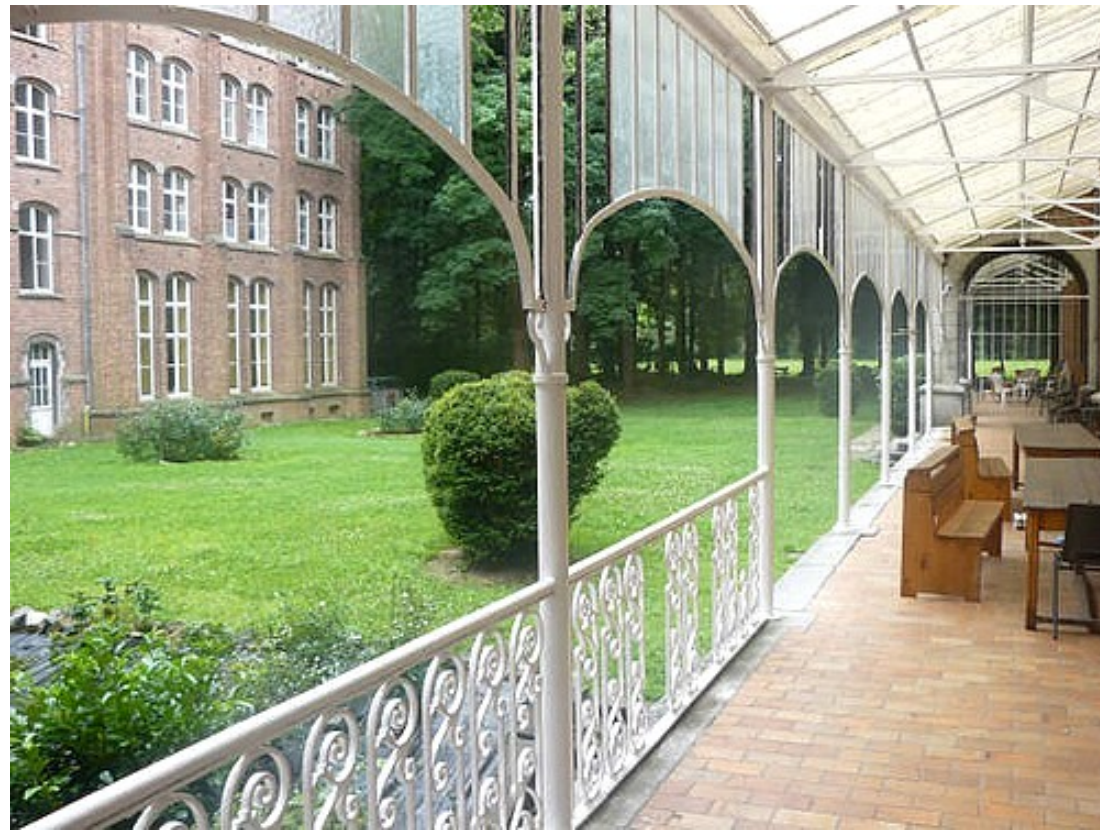
Het binnenhof 1.