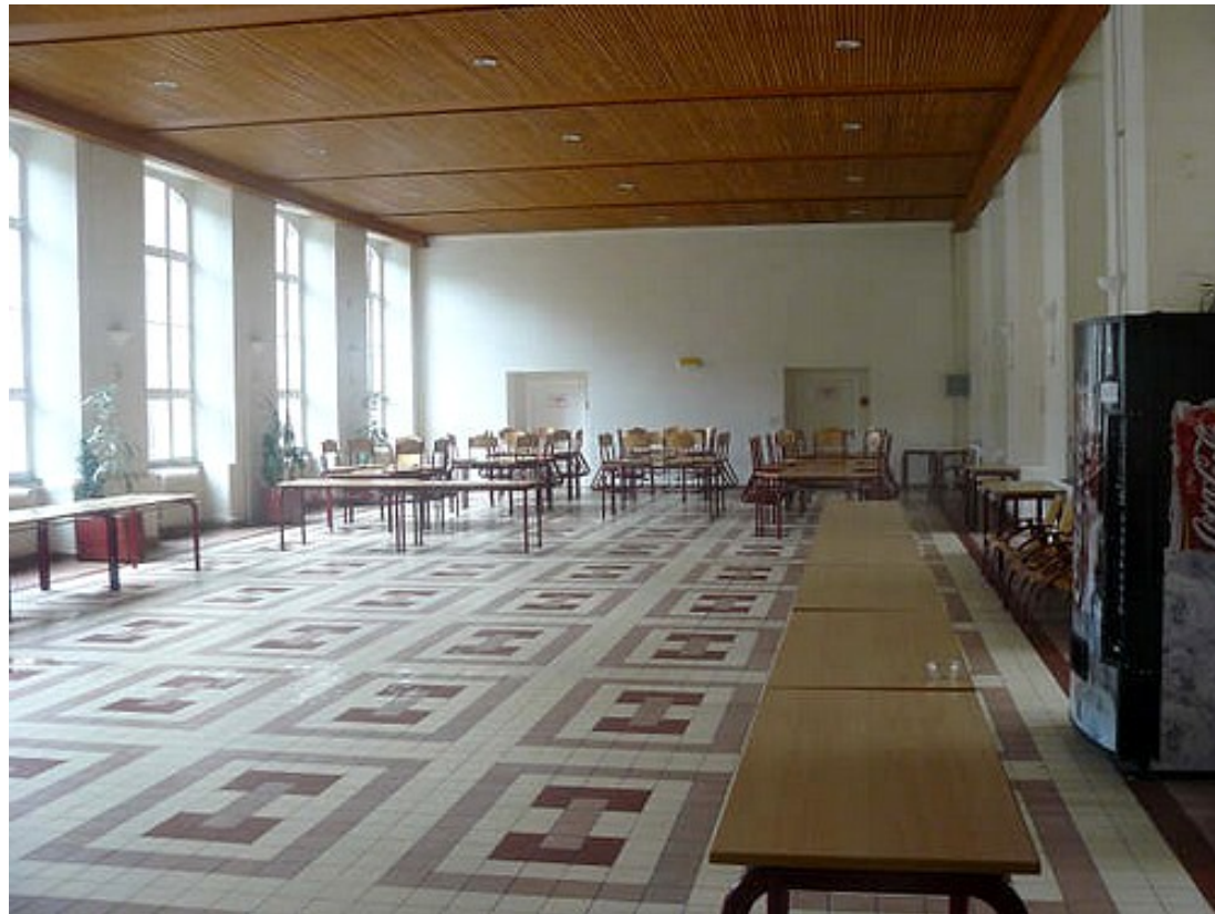
De algemene eetzaal (refter).

Bij de films blijft toch the Lord of the Rings een sleutelpositie innemen. Wat betreft boeken is mijn absolute favoriet 'De Eed' van Frank Peretti, een zeer spannende bovennatuurlijke thriller. Zoals al eerder gezegd houdt ik erg van muziek en om daar een favoriet uit te kiezen is onmogelijk. Momenteel luister ik graag naar de CD 'Furthermore' van Jars of Clay en 'Look to You' van Hillsong United. Ondanks al het verfijnde eten wat er op aarde bestaan houdt ik toch het meest van een goede pizza met een koud glas cola. En favoriete vakantieland is niet zo moeilijk nu ik net drie weken in het schitterende Canada heb doorgebracht. Landen zoals Nieuw Zeeland en Australië zou ik ook nog wel eens willen bezoeken.