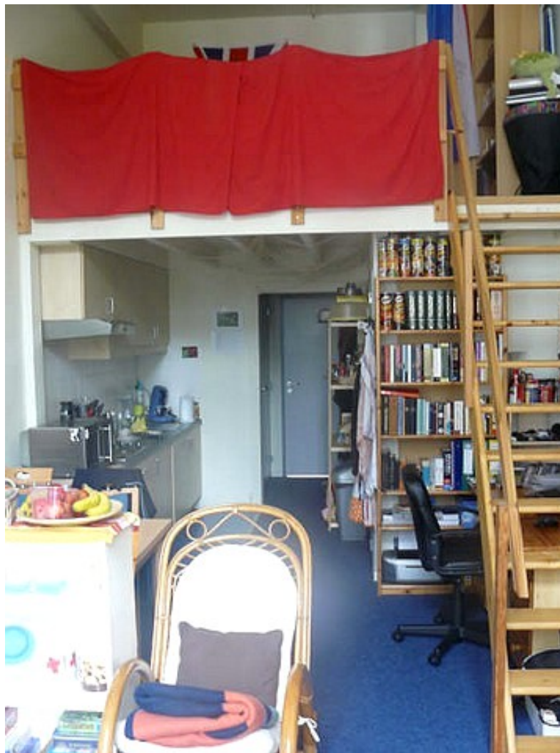
De binnenkant van onze studio 2.