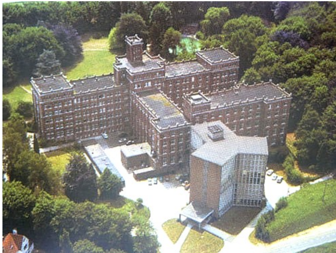
Een luchtfoto van het klooster waar we wonen.