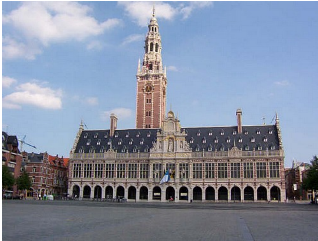
Het Ladeuzeplein met één van de bibliotheken van de KUL.