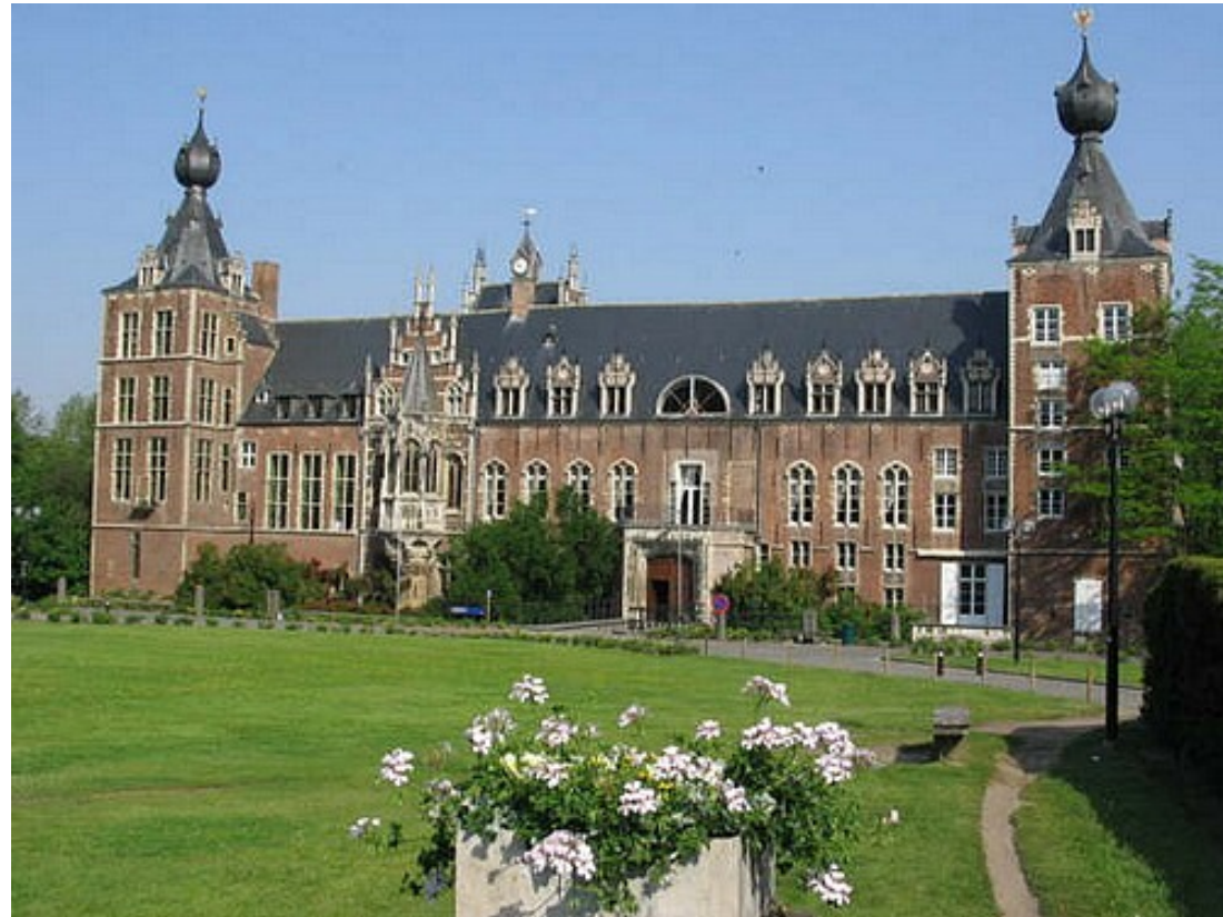
Kasteel Arensberg, tegenwoordig ook een studentencampus.

www.amazon.de (hier is alles goedkoop... ik blijf toch echt een Nederlander)