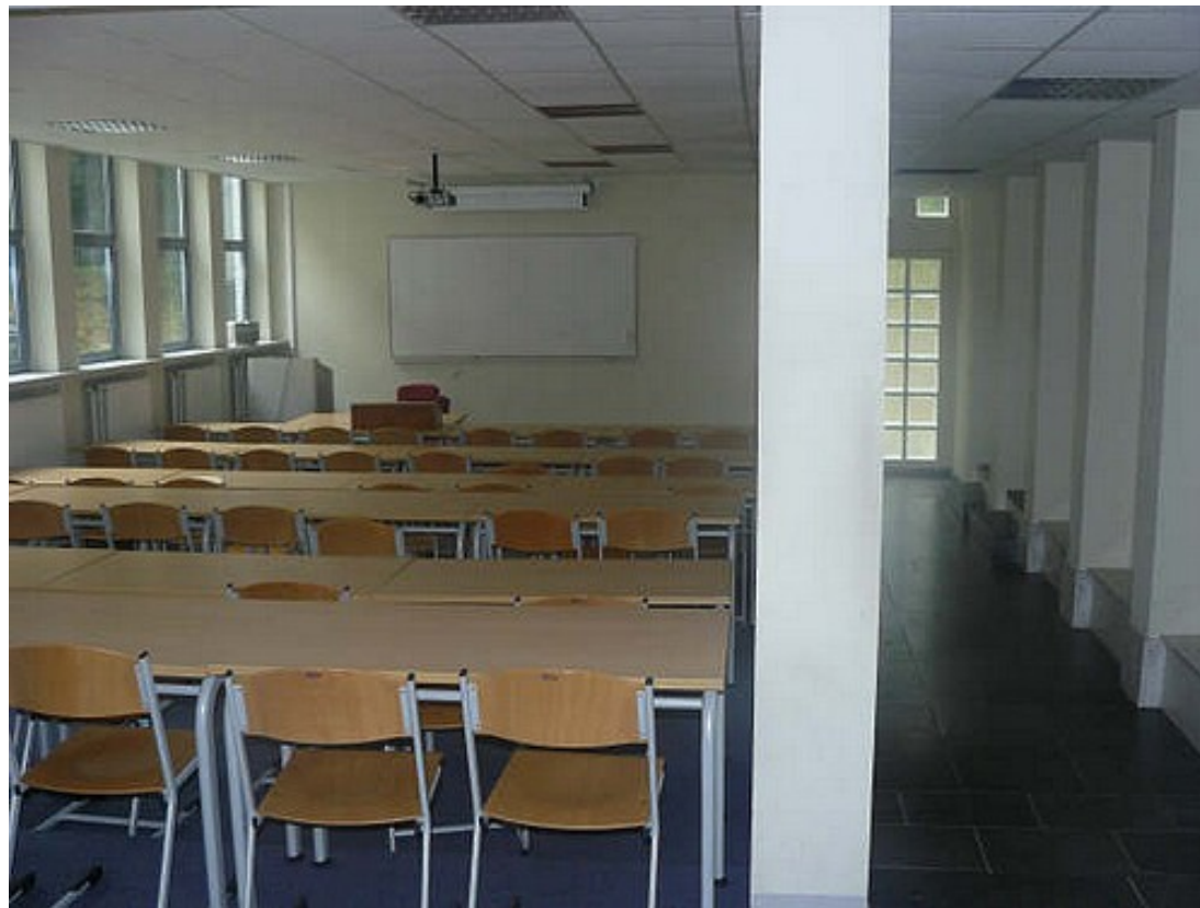
Eén van de klaslokalen op ETF.