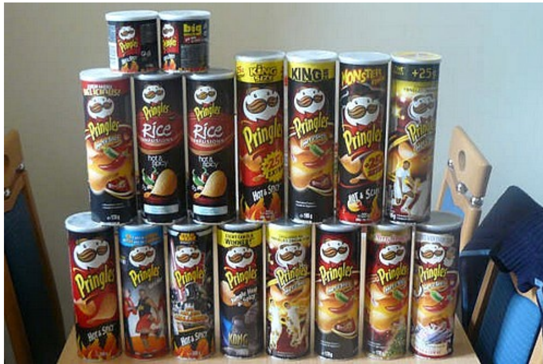
Jaap's verzameling Pringlesbussen.