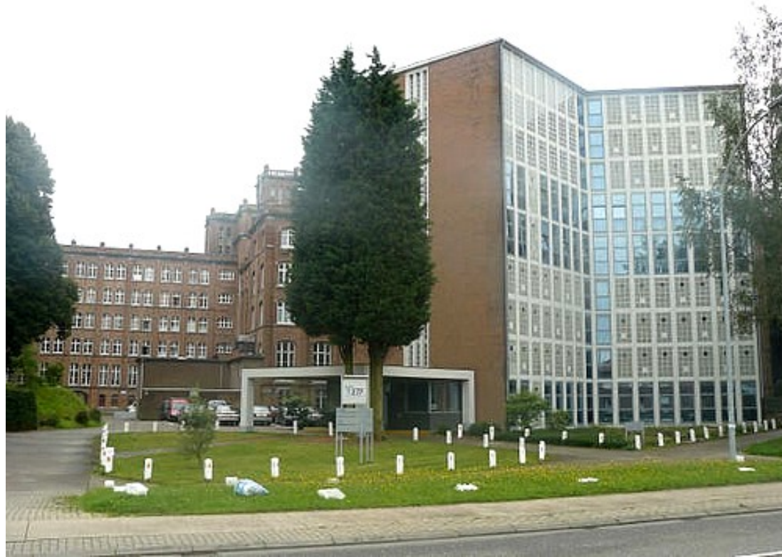
De voorkant van ETF.