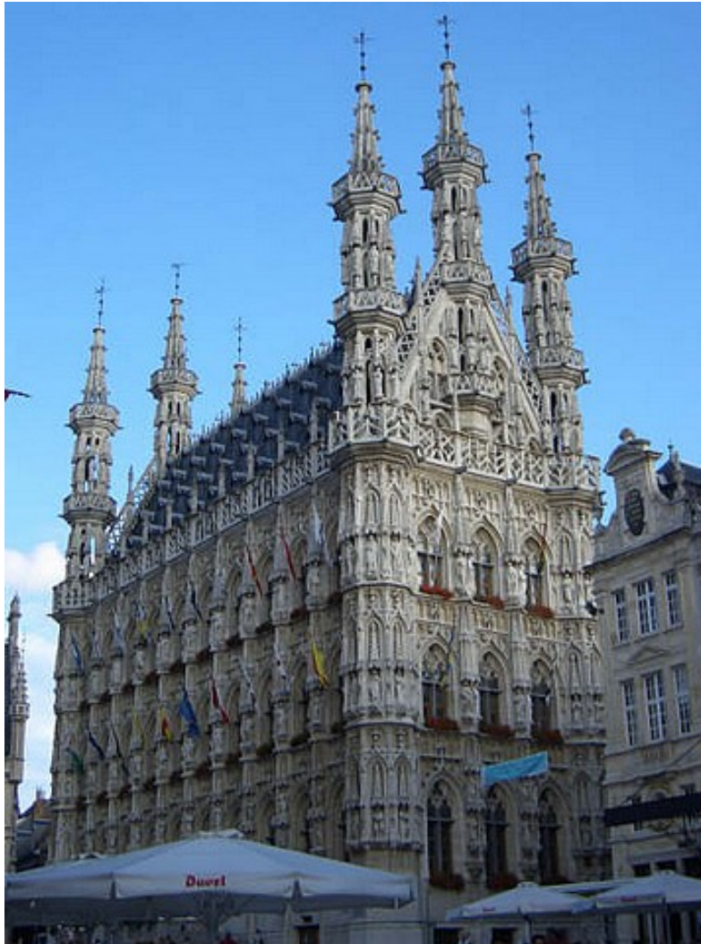
Het stadhuis van Leuven.

Nou eerst maar weer eens naar Nederland terug, dan zien we dan wel weer verder. Mijn eigen ervaring grotendeels in België maar deels ook in Duitsland leert me dat hoewel emigreren een kort proces kan zijn, het inburgeren en gewend raken aan taal en cultuur van een ander land iets is wat zeker niet onderschat moet worden. Een ander land staat voorlopig zeker niet op de planning. Wat betreft steden zouden we het liefst in een buitenwijk van een redelijke stad terecht komen zodat we een beetje tussen dorp en de Randstad in zitten.