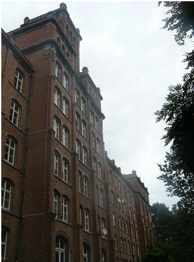
De achterkant (vroeger de voorkant).