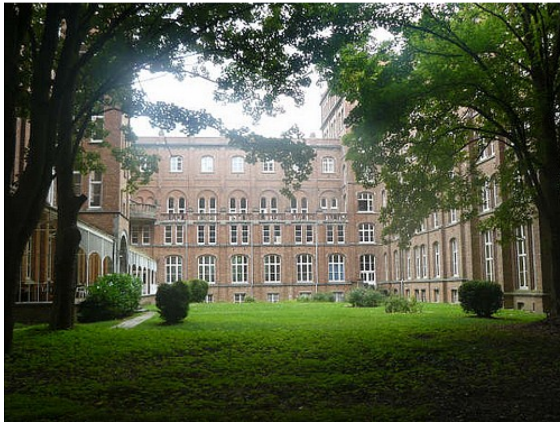
Het binnenhof 2.