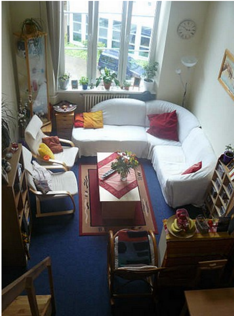
De binnenkant van onze studio 1