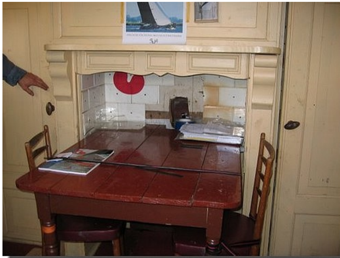
Ook de tafel van de bemanning van vroeger was nog steeds aanwezig.