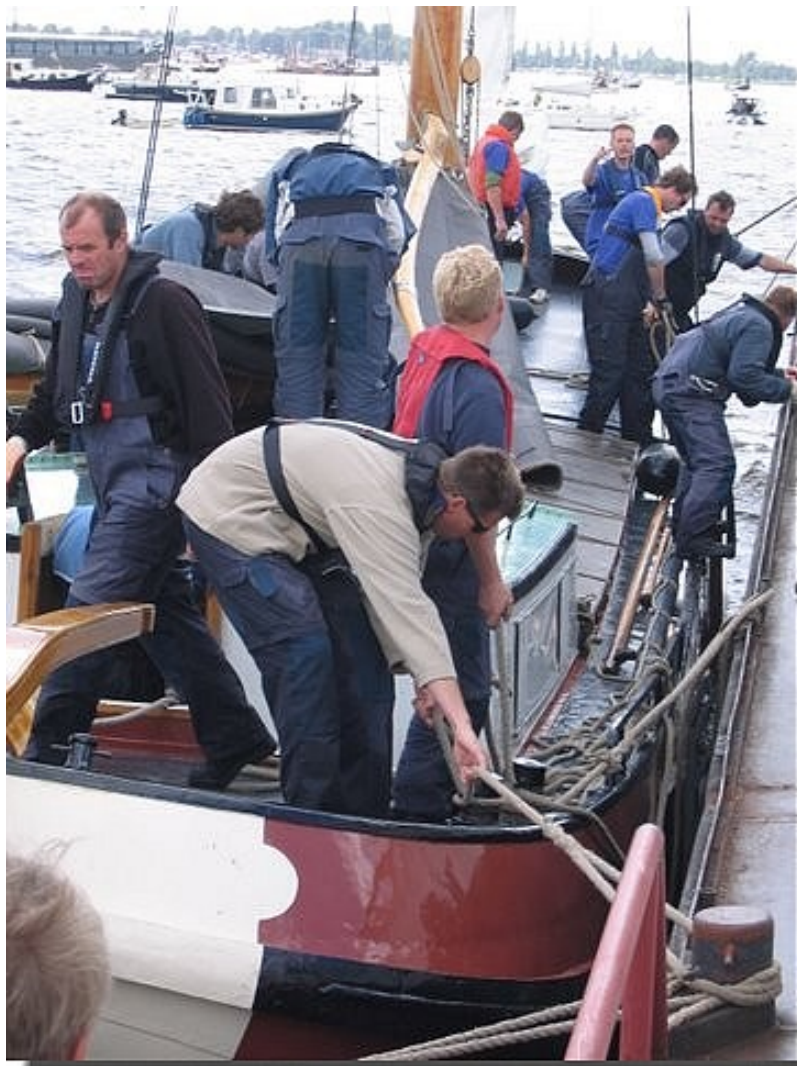
De boel even goed vastsjorren...