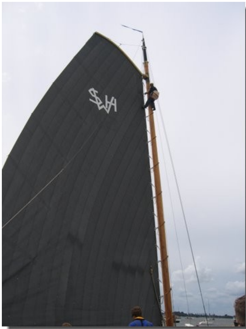
Hier schipper Auke de Groot zelf boven in de mast.