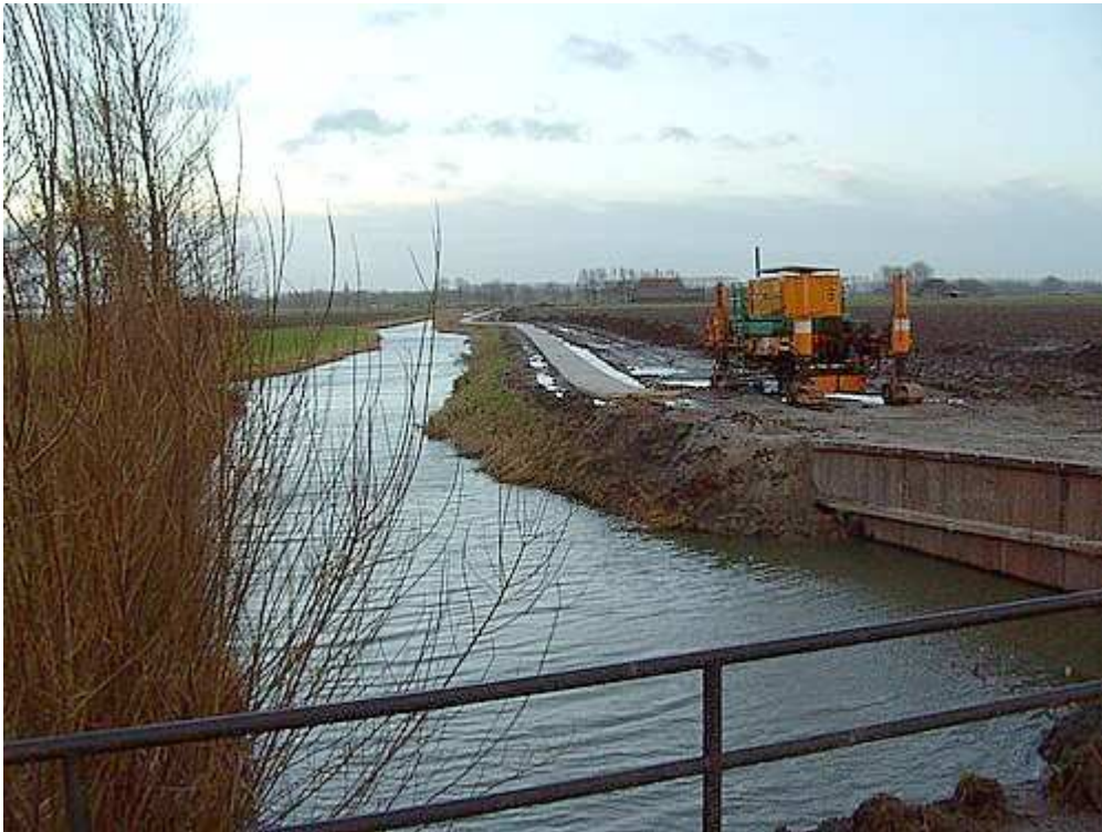
Zware machines leggen een betonnen fietspad aan langs de vaart richting Marssum.