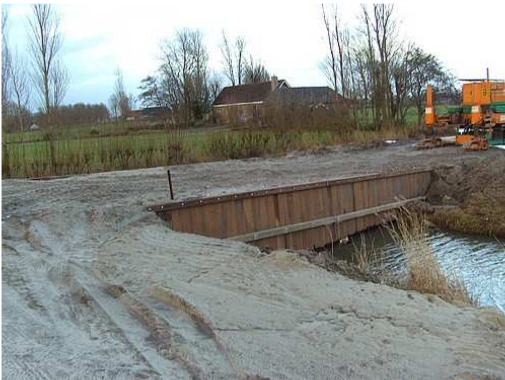
Het huis van de familie Papa op de achtergrond.