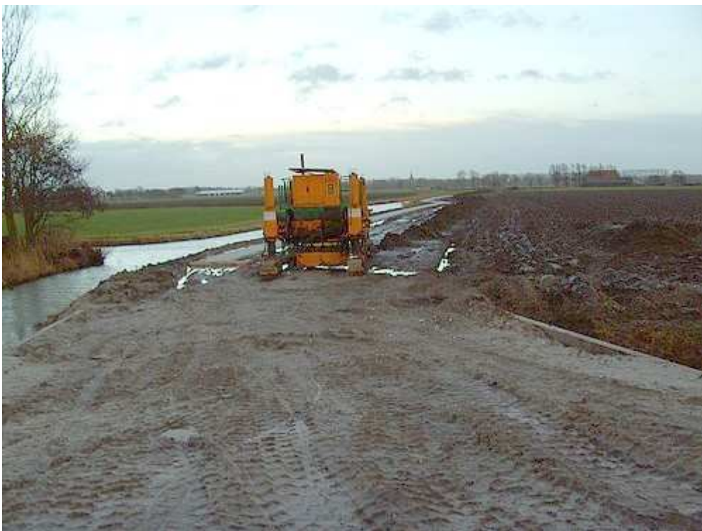
Onder de dam ligt een buis die zorgt voor een waterverbinding met het achterland.