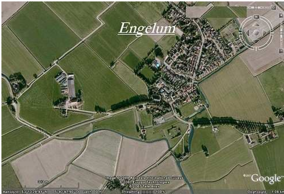
Engelum op 1 kilometer hoogte.