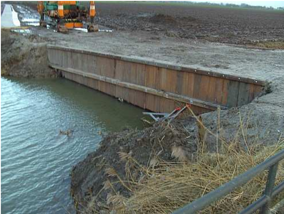
Zware houten damwanden verstevigen de dam.