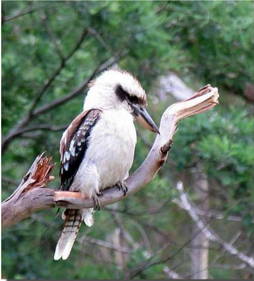
(Kookaburra. Een vlees etende vogel. Deze vogel maakt een schaterend geluid.)