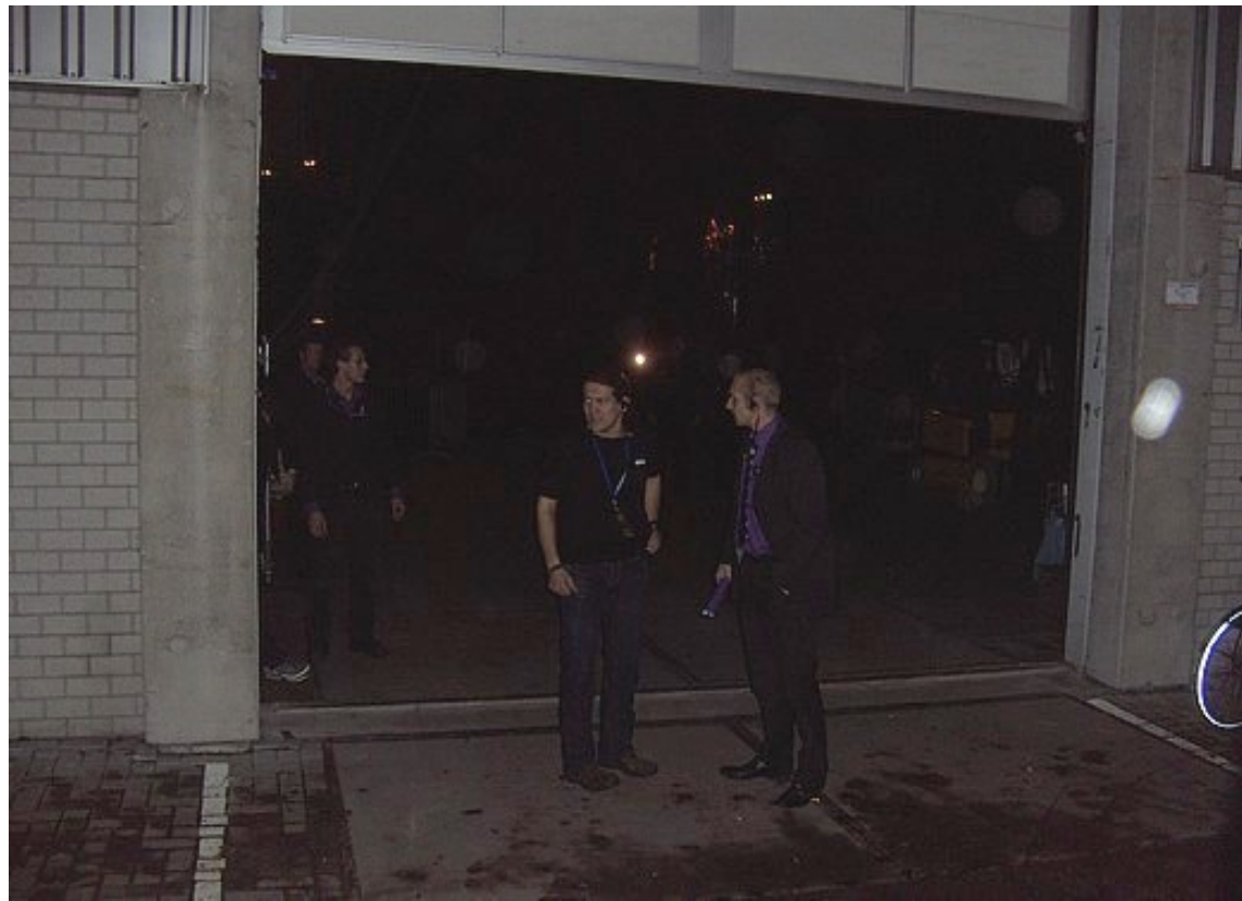
De chauffeur moest scherp insteken om door deze Haldeur te rijden.