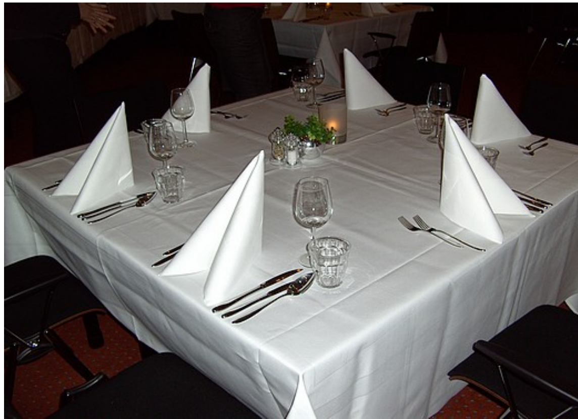
In een zaal waren 10 tafels keurig ingedekt voor het lopend buffet.