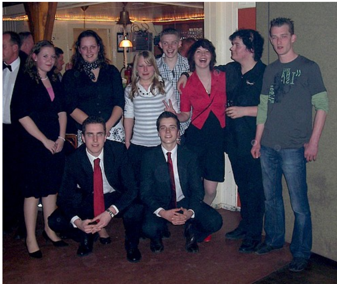
Er was een verslag van het slotbal van de danslessen.