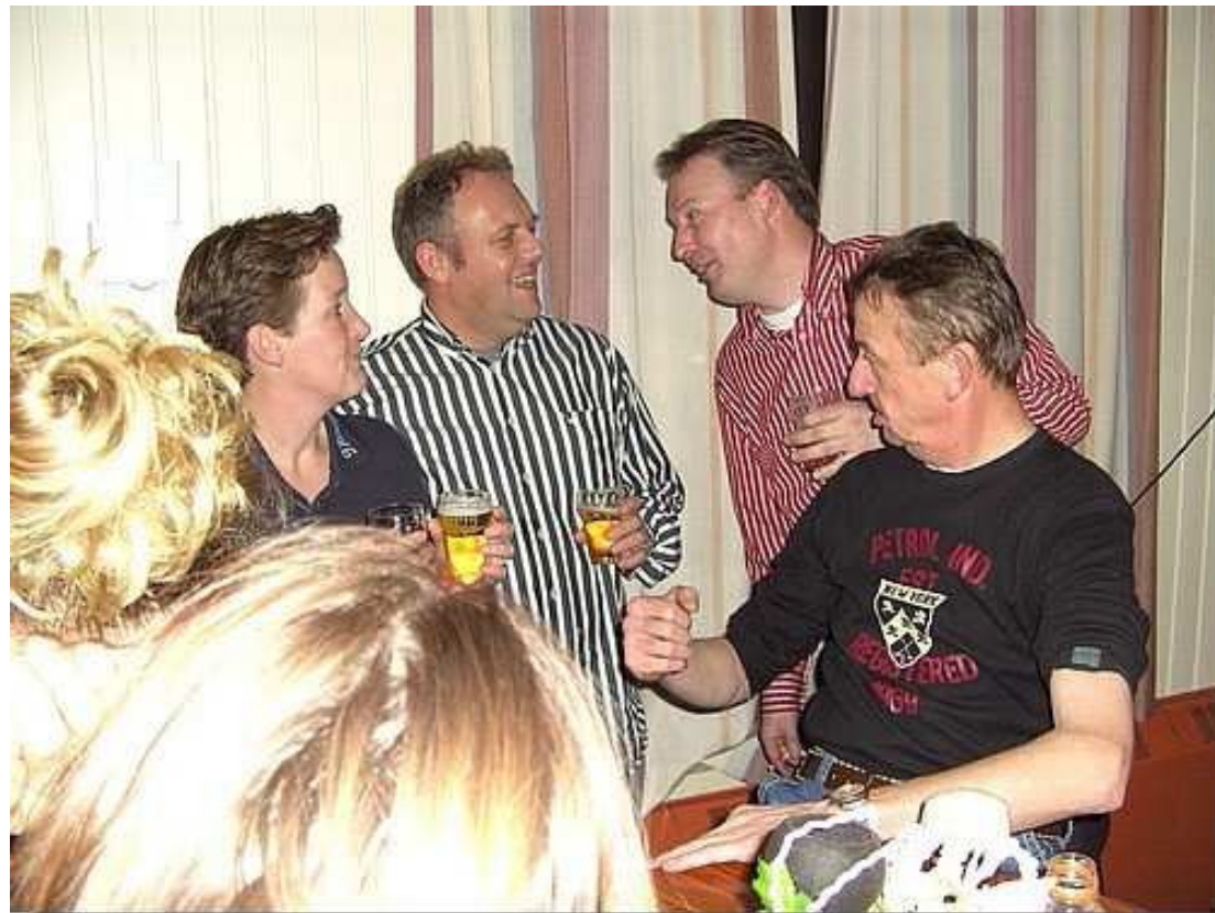
En gezellig was het tijdens de nieuwjaarsborrel.