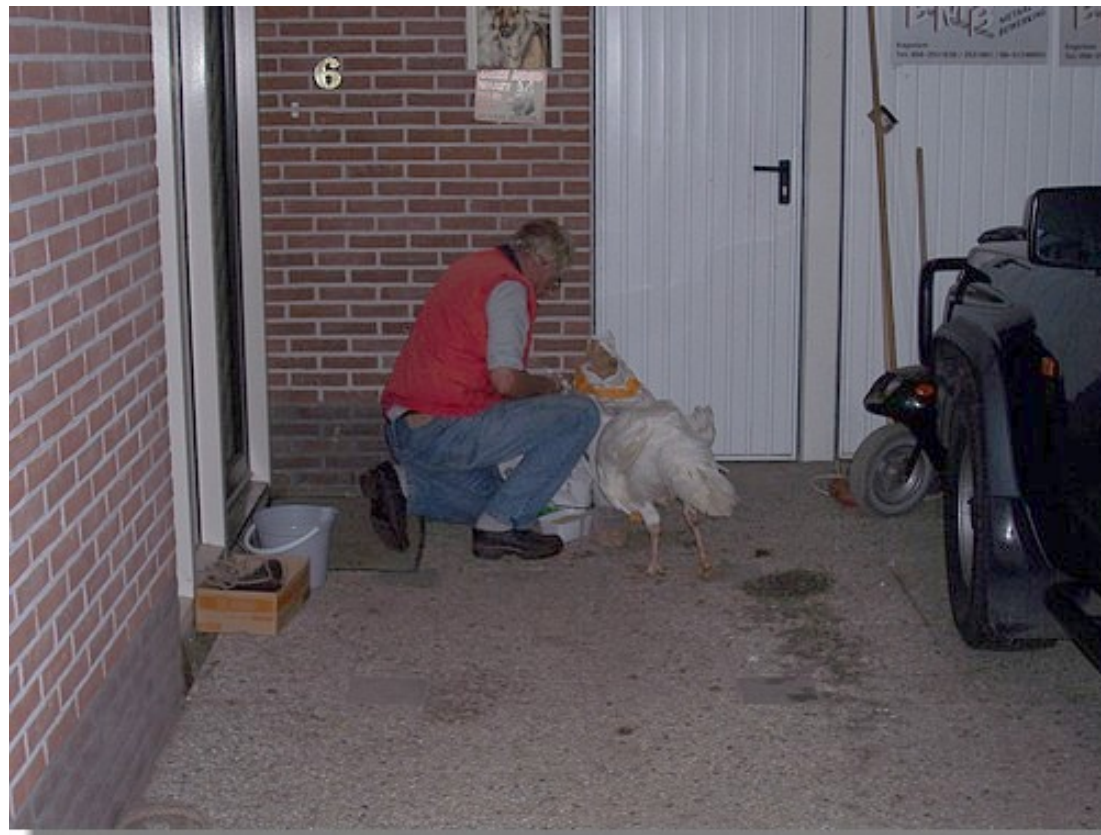
De veestapel van de Bruinings wordt namelijk steeds groter.