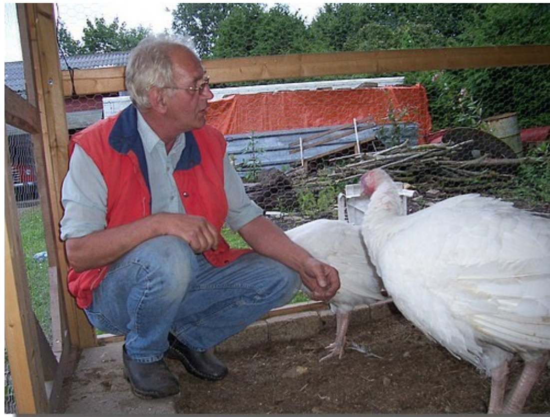
De kalkoenen zijn bijzonder mak en nieuwsgierig.