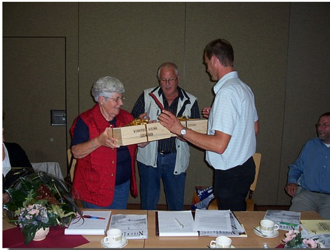
Een kist met een lekkere fles wijn...