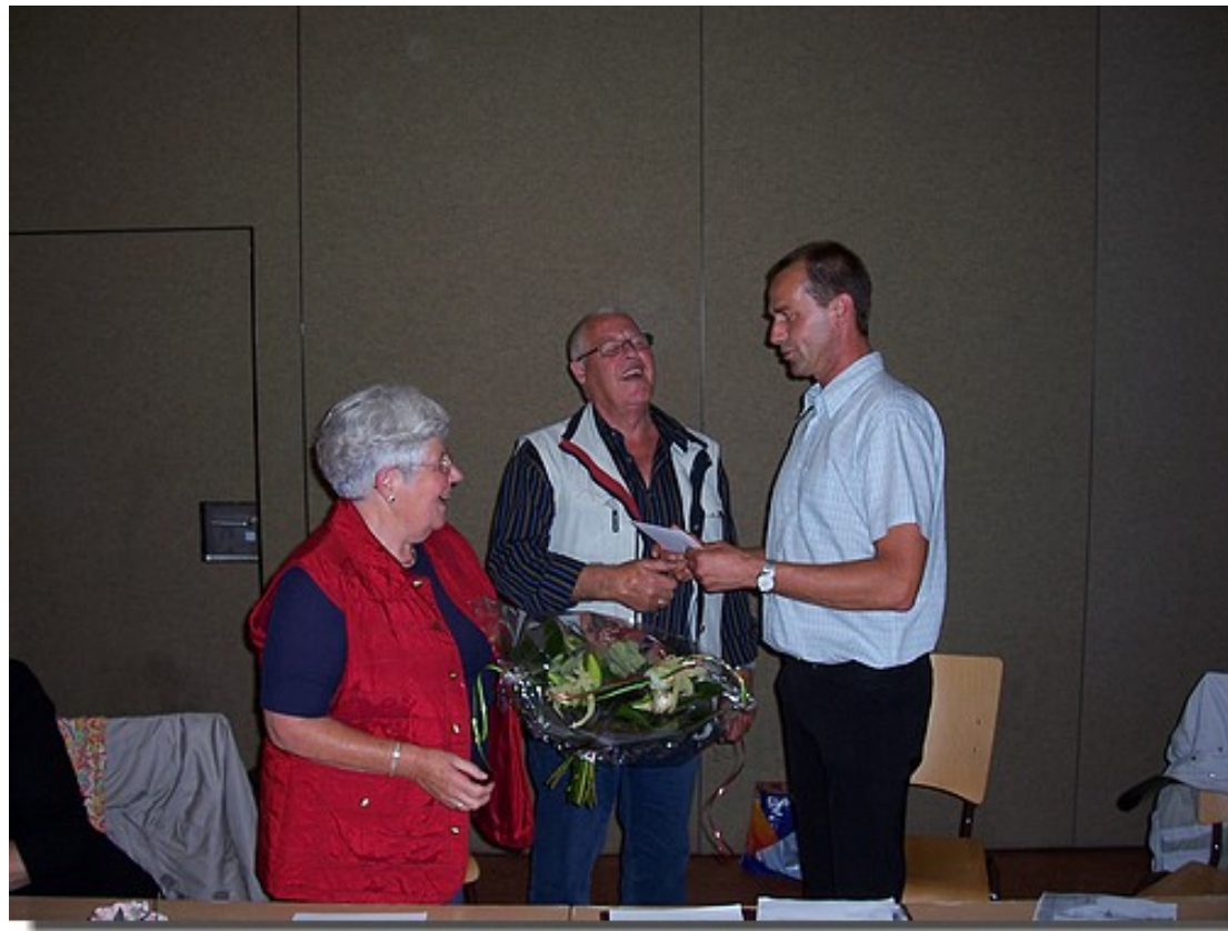
En er waren natuurlijk bloemen en cadeaus.