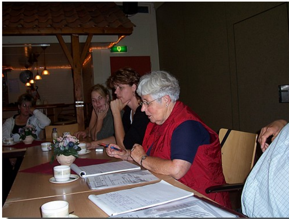
En Anne al meer dan 40 jaar achter de tafel.