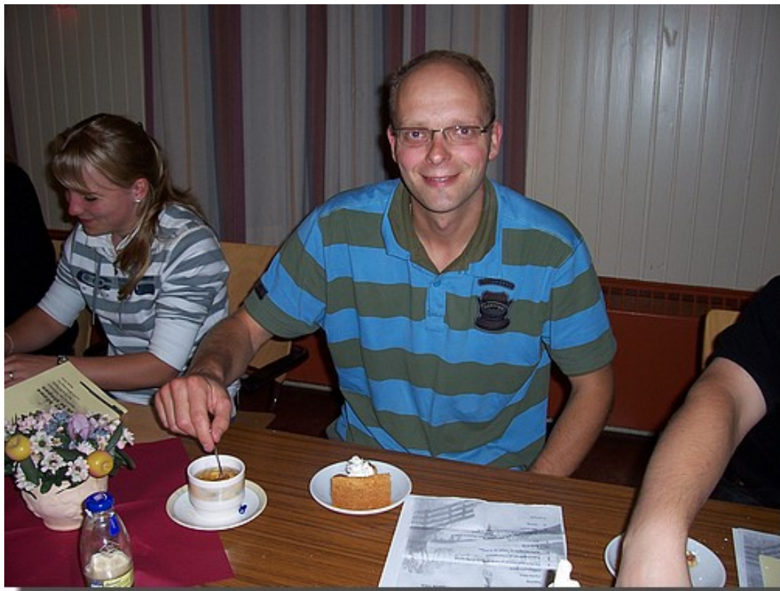
Een bakkie met zo te zien wat lekkers er bij....