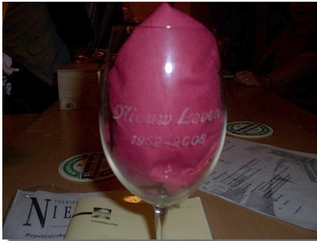
En een glas met de volgende inscriptie: 'Nieuw Leven 1962-2008'